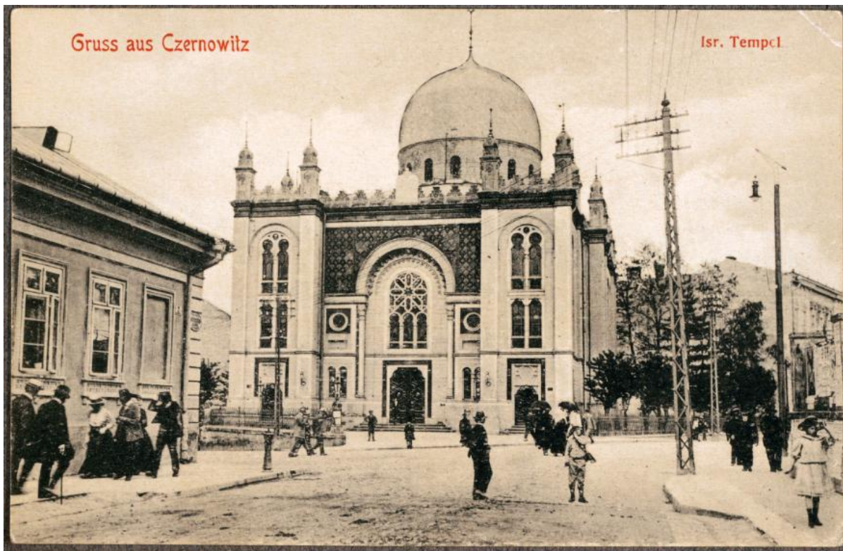
Темпл, открытка начала XX века

— Академическая конференция, да еще на столь специфическую тему, вряд ли привлечет внимание массовой аудитории... Какую культурную программу предложат горожанам в эту августовскую неделю?