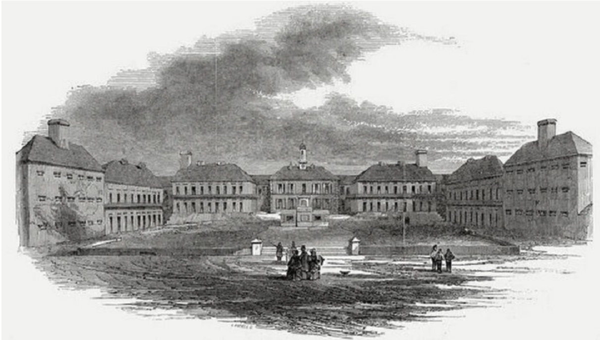
Тюрьма «Паркхёрст», XIX век