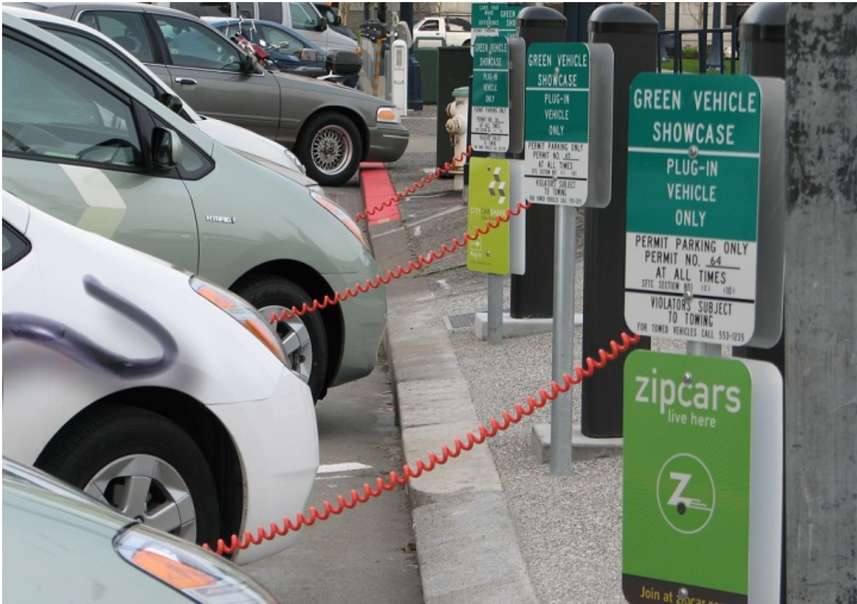
Зарядка електромобілей, Сан-Франциско