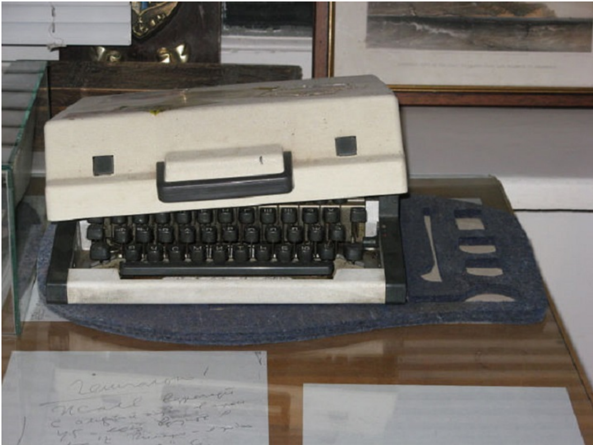
Пишущая машинка Юлиана Семенова