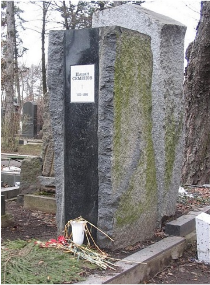
Могила-кенотаф Юлиана Семенова