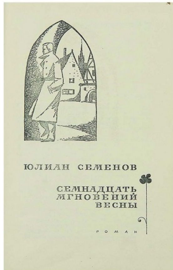
Одно из первых изданий романа «Семнадцать мгновений весны», 1970