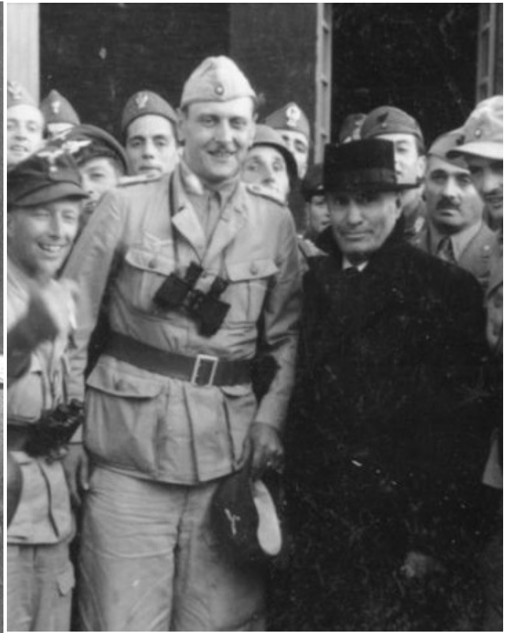
Скорцени с освобожденным из заключения Бенито Муссолини