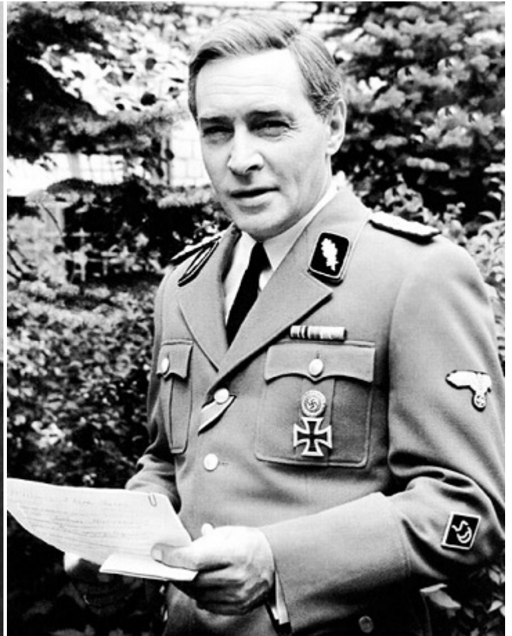
Вячеслав Тихонов в роли Штрика

Благодаря характерам, искусно выписанным Юлианом Семеновым, четко выверенной режиссуре Лиозновой и блестящей игре Тихонова, Броневого, Табакова и далее по списку главные герои получились не карикатурными, а умными, рассудительными и сметливыми врагами. Партия и правительство высоко оценили картину: в 1976-м ее создатели были удостоены Государственной премии СССР, а через два года — премии КГБ.