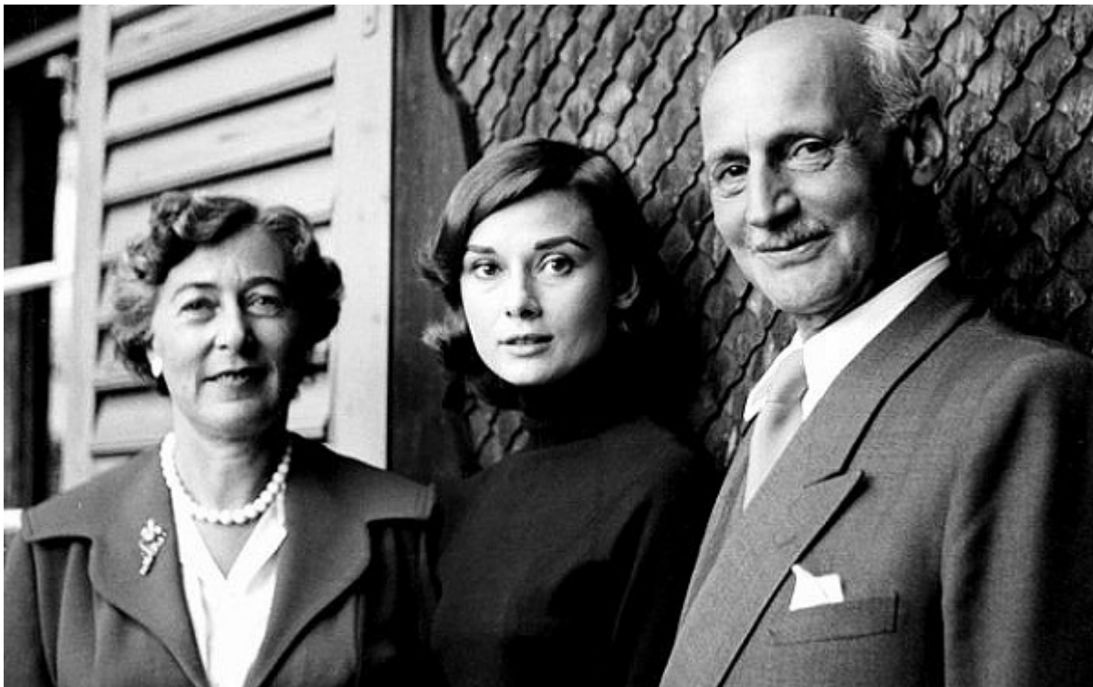
Одри Хепберн с Отто Франком и его второй женой, 1957