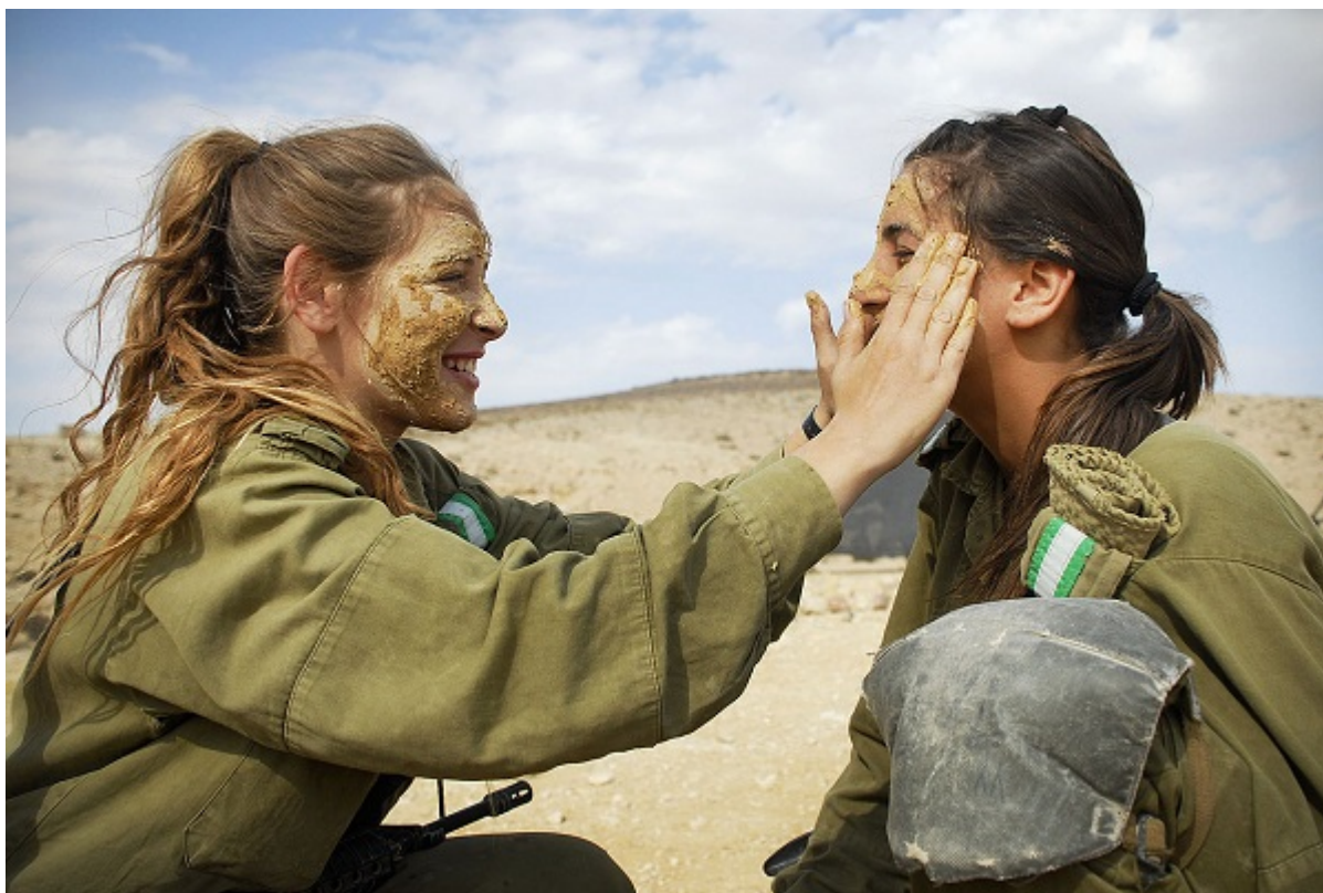
Девушки-солдатки готовятся к учениям

Но почему не наблюдается аналогичная картина среди женщин? То, что процент призыва женщин почти не изменился, указывает на положительную тенденцию. Видимо, женщины из национально-религиозного лагеря стали чаще отказываться от альтернативной службы в пользу действительной службы в ЦАХАЛе.