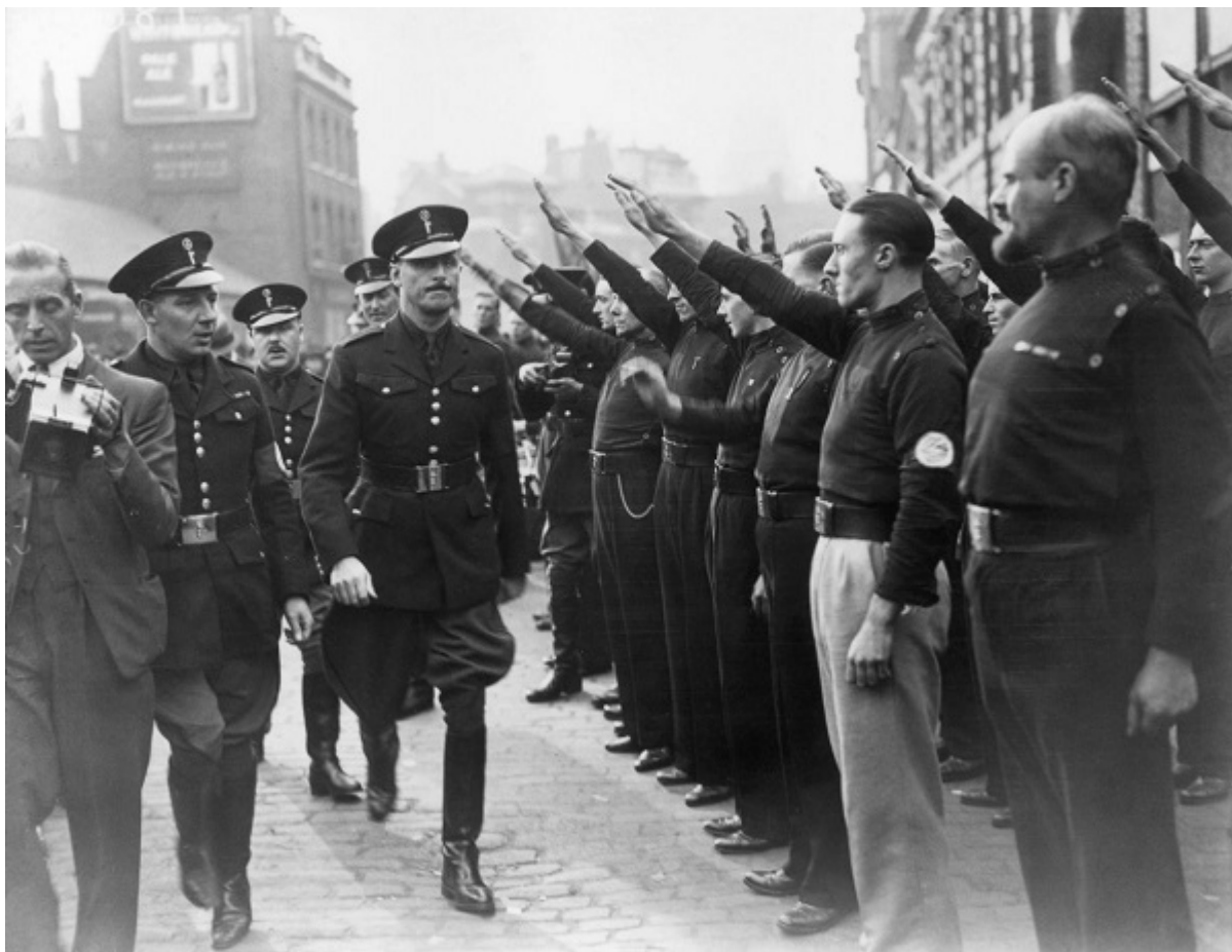
Освальд Мосли на параде Британского союза фашистов, 1930-е.

«Группа 43» превратилась из маленького союза бывших солдат-евреев, наслаждавшихся стычками с фашистами в лондонском Ист-Энде, где в то время еще жило большинство английских евреев — в сложную организацию, насчитывающую до двух тысяч членов, с департаментами разведки и наружного наблюдения.