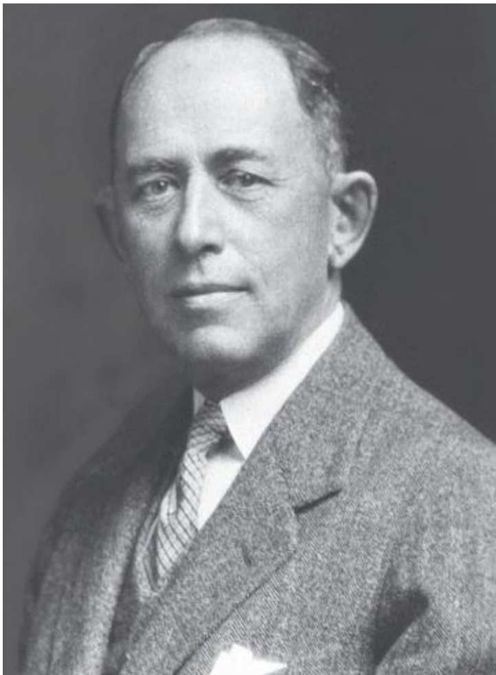
Мойсей (Моше) Новомейский