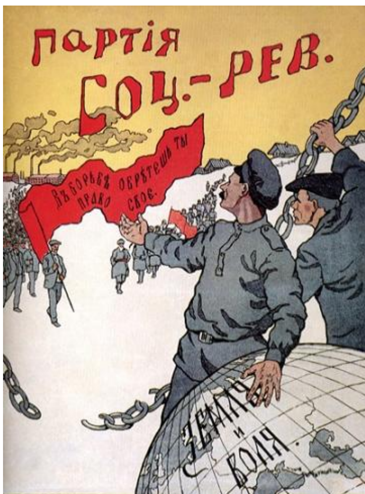
Передвиборний плакат есерів, 1917 рік