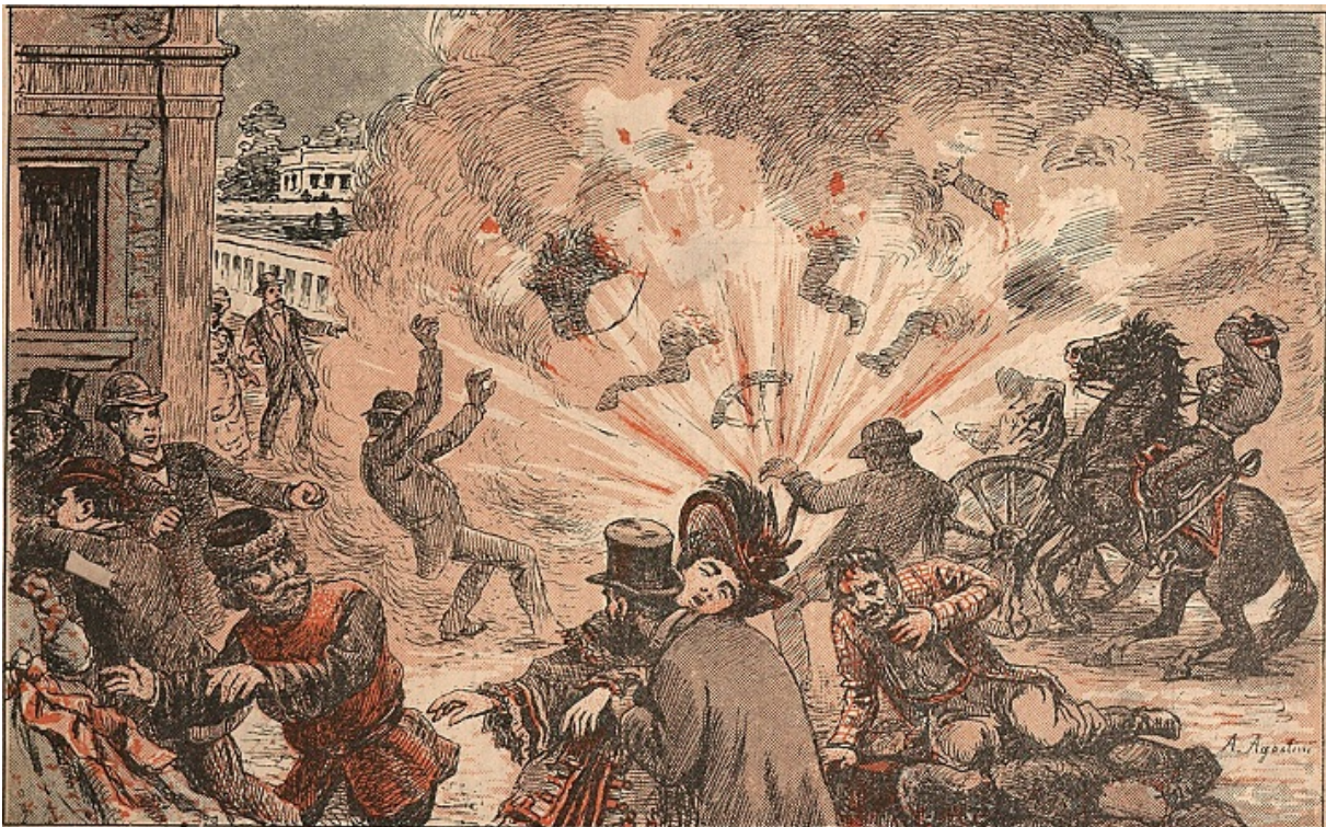
Вбивство В'ячеслава фон Плеве есером Єгором Сазоновим, 1904