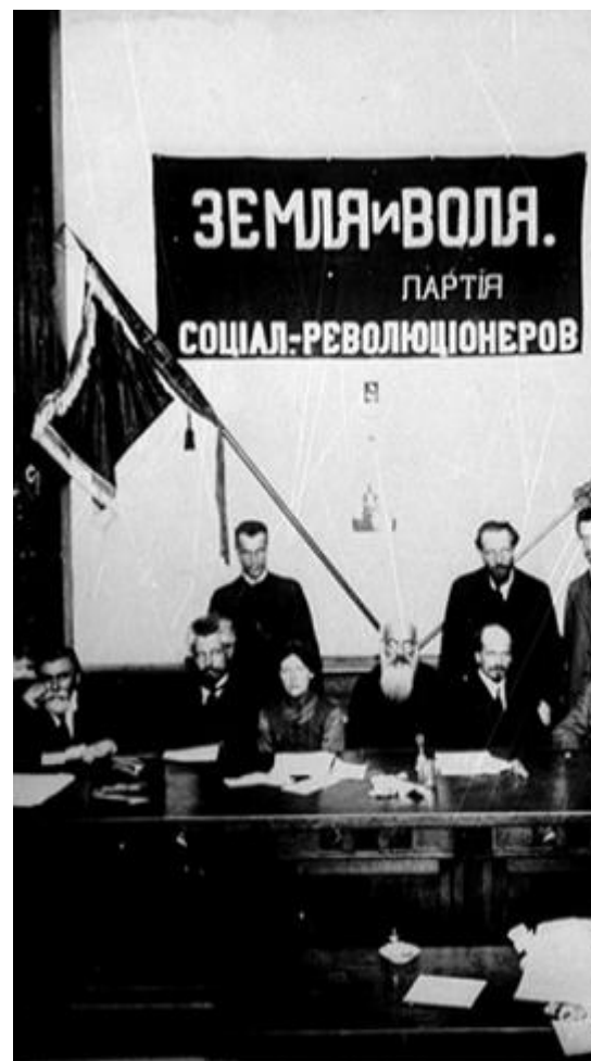
Лідери партії на її III з'їзді, червень 1917 року