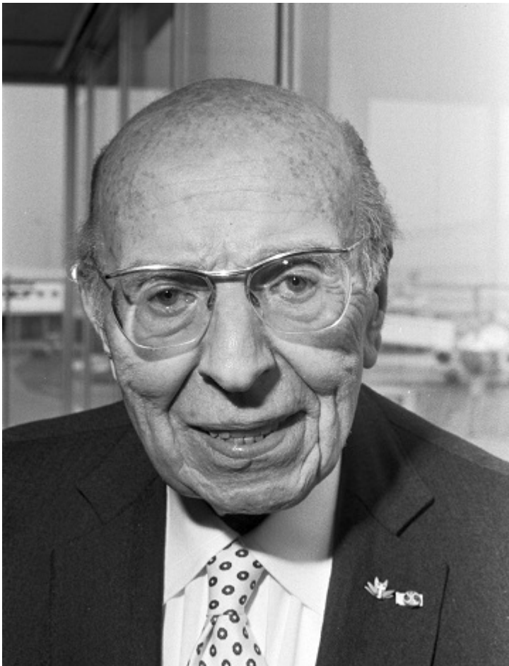
Композитор у 1970 році

Після війни, незважаючи на влаштоване життя у Сполучених Штатах, композитор прагне повернутися до Відня. Як тільки американська окупаційна влада дозволила в'їзд на територію Австрії, дозвіл під №1 було видано Роберту, а під №2 його дружині. 30 листопада 1946 року в Віденському аеропорту їх зустрів мер столиці і кілька тисяч городян. Відень ще в руїнах, постачання йде з перебоями, але для її жителів повернення композитора — символ прийдешнього відродження країни. 66-річний композитор приступає до роботи на рідній землі — нові оперети, музика до фільмів і театральних вистав, записи старих класичних оперет на пластинки.