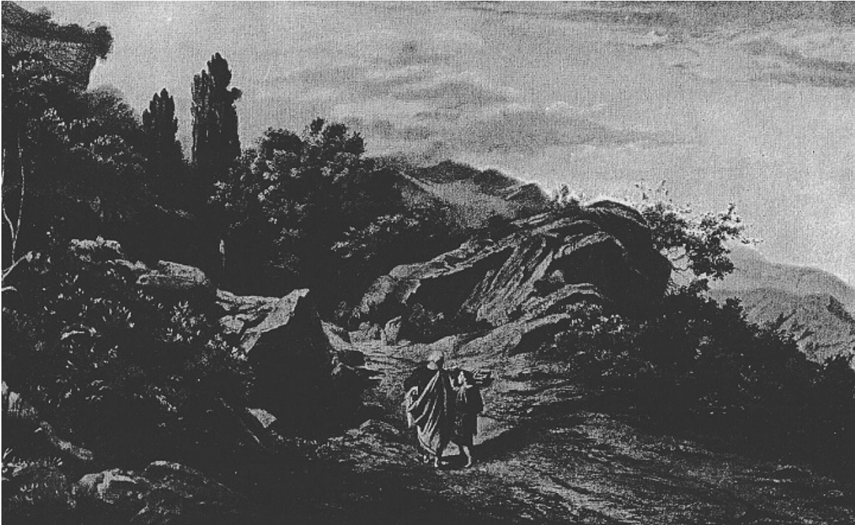
«Авраам з Іцхаком піднімаються на гору Морія», ілюстрація з книги The Bible and Its Story Taught by One Thousand Picture Lessons

«І пішли вони разом обоє». На цьому етапі з'являються предмети, які не показувалися у першому акті, — ніж і кресало, раніше, очевидно, заховані, тепер підтверджують усі підозри. Люблячий батько ніс знаряддя цілопалення: ніж, аби зарізати ним сина, і кресало, щоб розпалити вогонь і засмажити на ньому синівську плоть. Улюблений син ніс те, що потрібно буде спалити: дрова й себе. Хто знає, можливо, Авраам витягнув ніж і кресало з потайної кишені, аби натякнути синові, що його чекає, і дати йому можливість урятуватися втечею? Можливо. Очевидно лише одне: Іцхак не втік, а лише здивовано запитав: