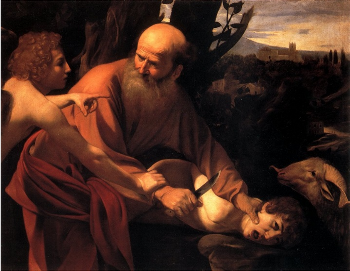
«Жертвопринесення Іцхака», худ. Караваджо