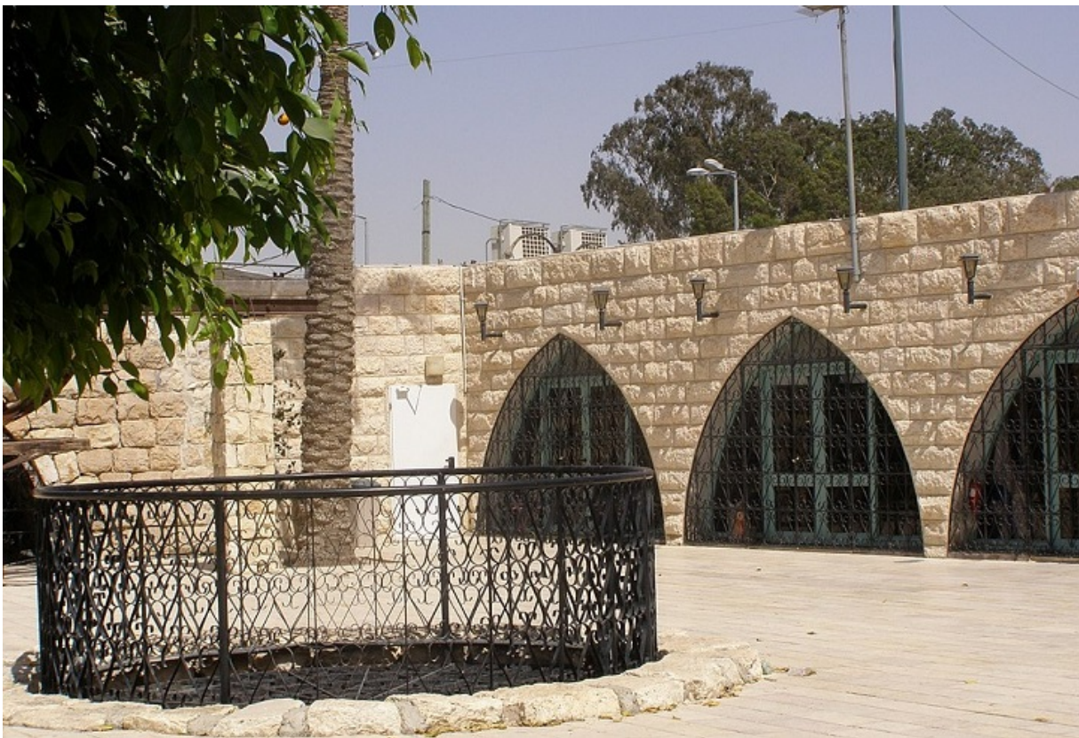
Колодязь Авраама в Беер-Шеві

В Авраама був дуже щасливий шлюб. Хто ще може похвалитися тим, що в одній особі він одержав не тільки дружину, коханку й господиню, але і союзницю в усіх починаннях? Але це жертвопринесення розділило не тільки батька із сином, а й чоловіка з дружиною. Сару ми теж більше не зустрінемо поруч з Авраамом. Він після жертвопринесення оселився в Беер-Шеві, а Сара, уже на початку наступного розділу, померла в Кір'ят-Арба — можливо, саме тому, що їй стала відома вся ця історія. Біблія говорить: «І прийшов Авраам голосити над Сарою та плакати за нею». Тобто, він не був поруч з дружиною, коли та помирала.