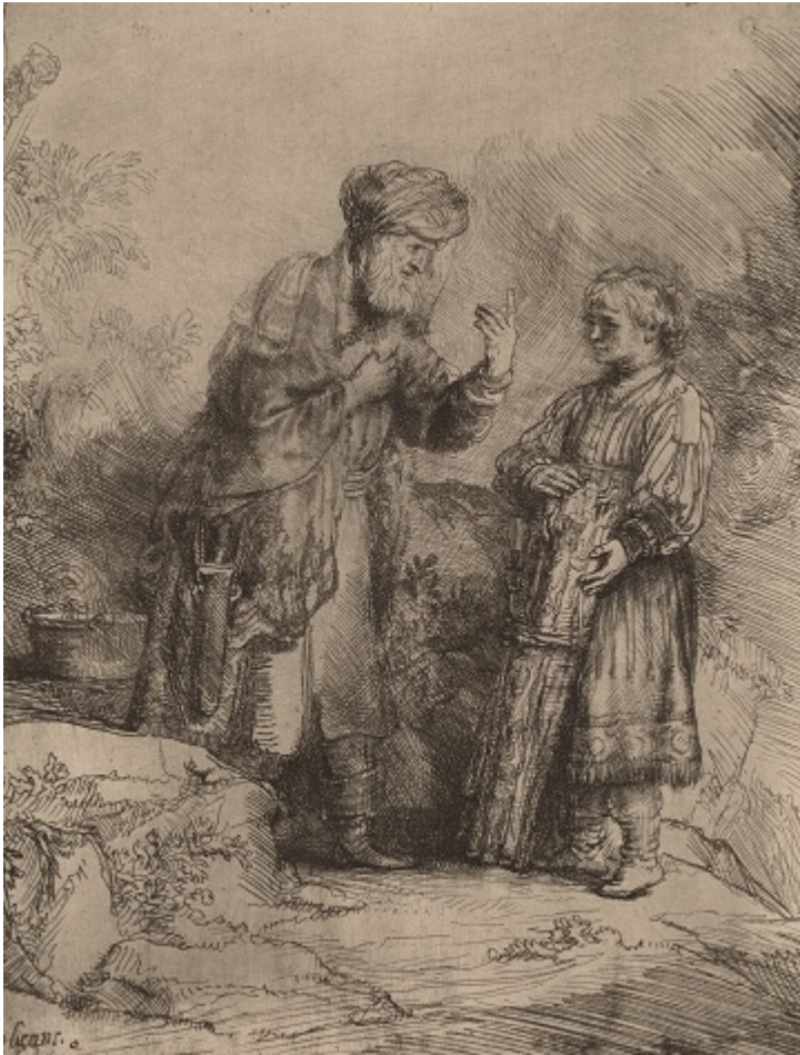
«Авраам та Іцхак», нарис Рембрандта, 1645