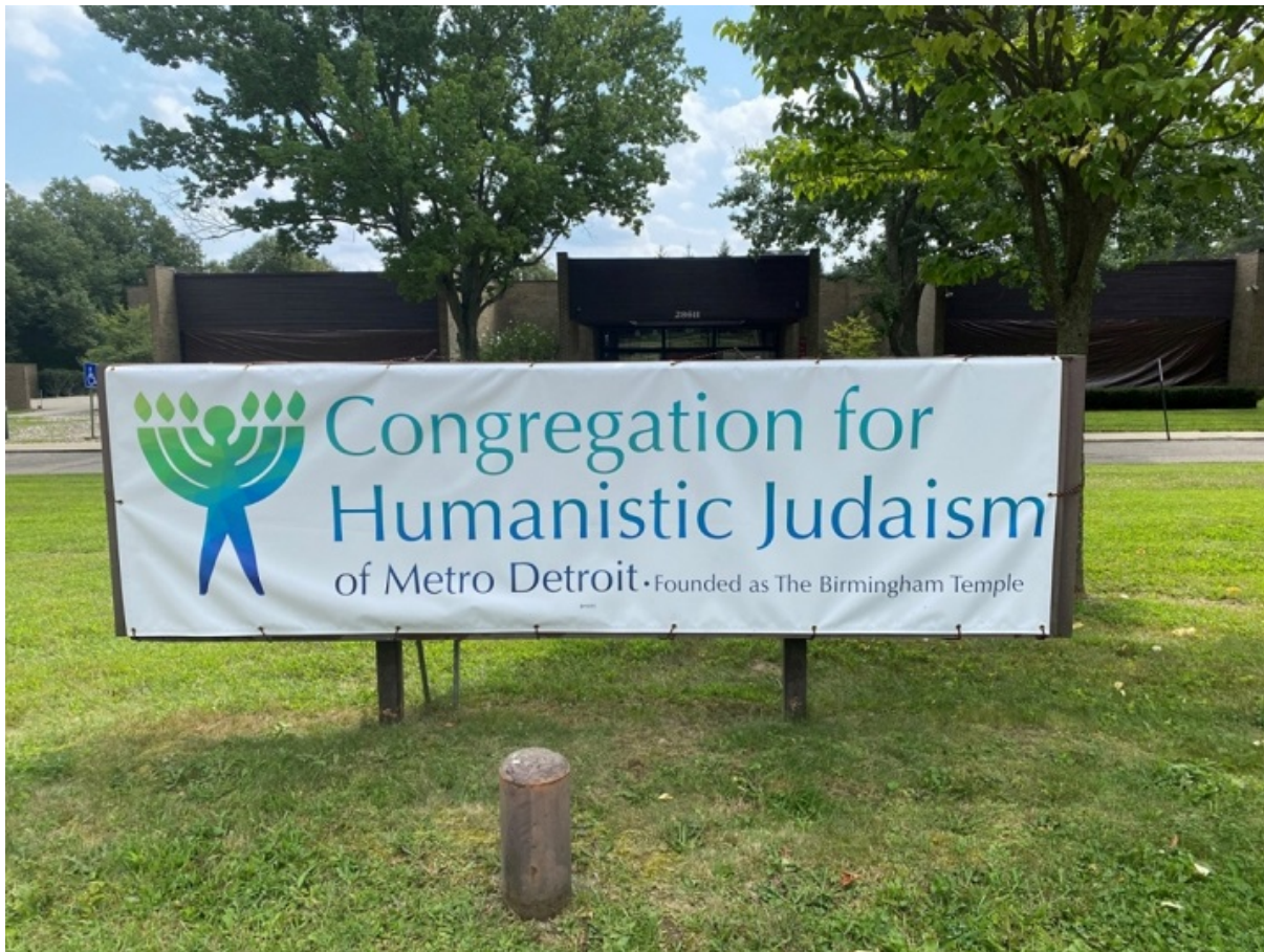
Баннер одной из общин гуманистического иудаизма

Есть даже целое течение гуманистического иудаизма, где божественная идея не имеет смысла. Представителя этого течения недавно избрали президентом капелланов Гарвардского университета.