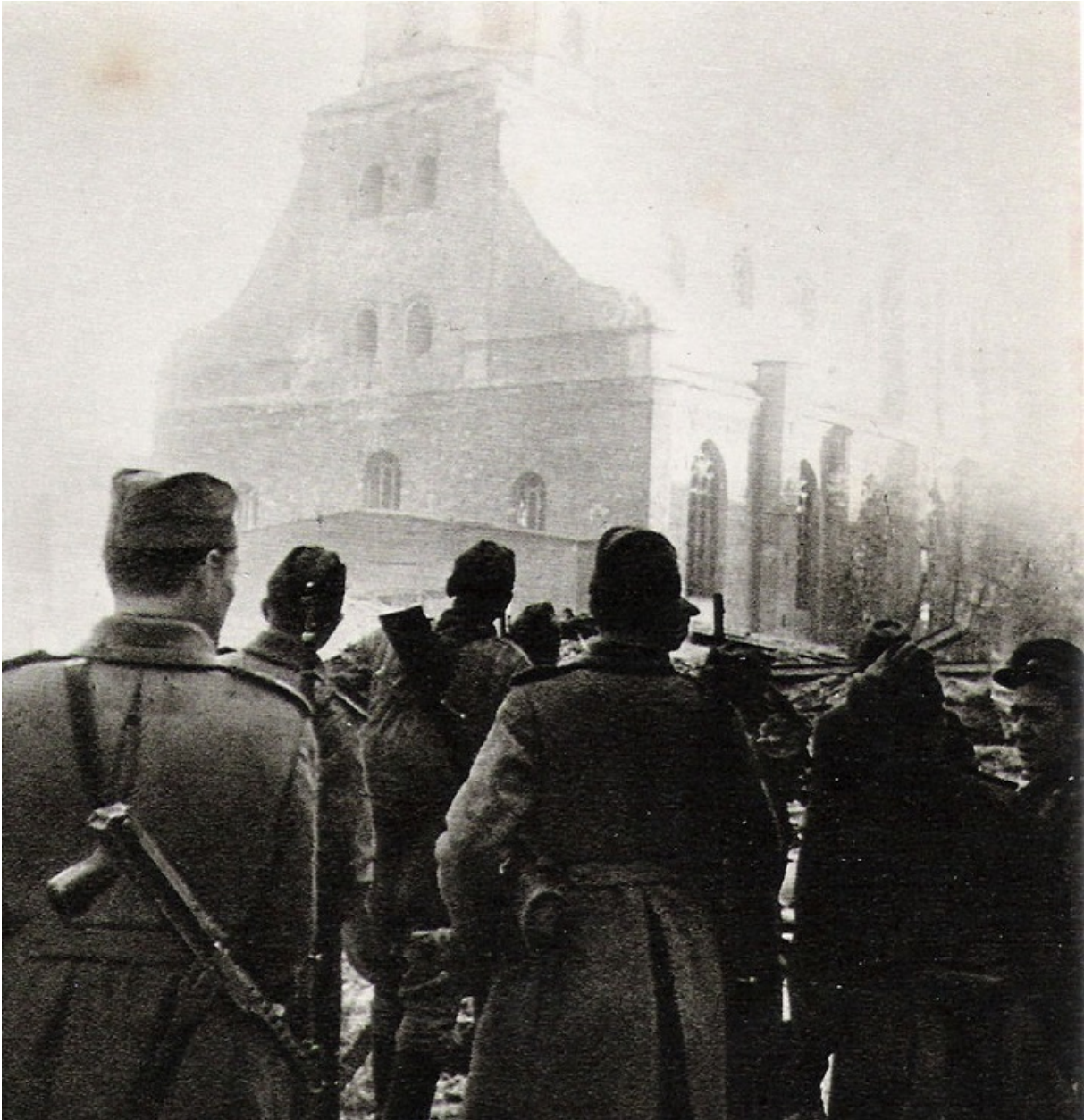
У звільненій Ризі, 1944