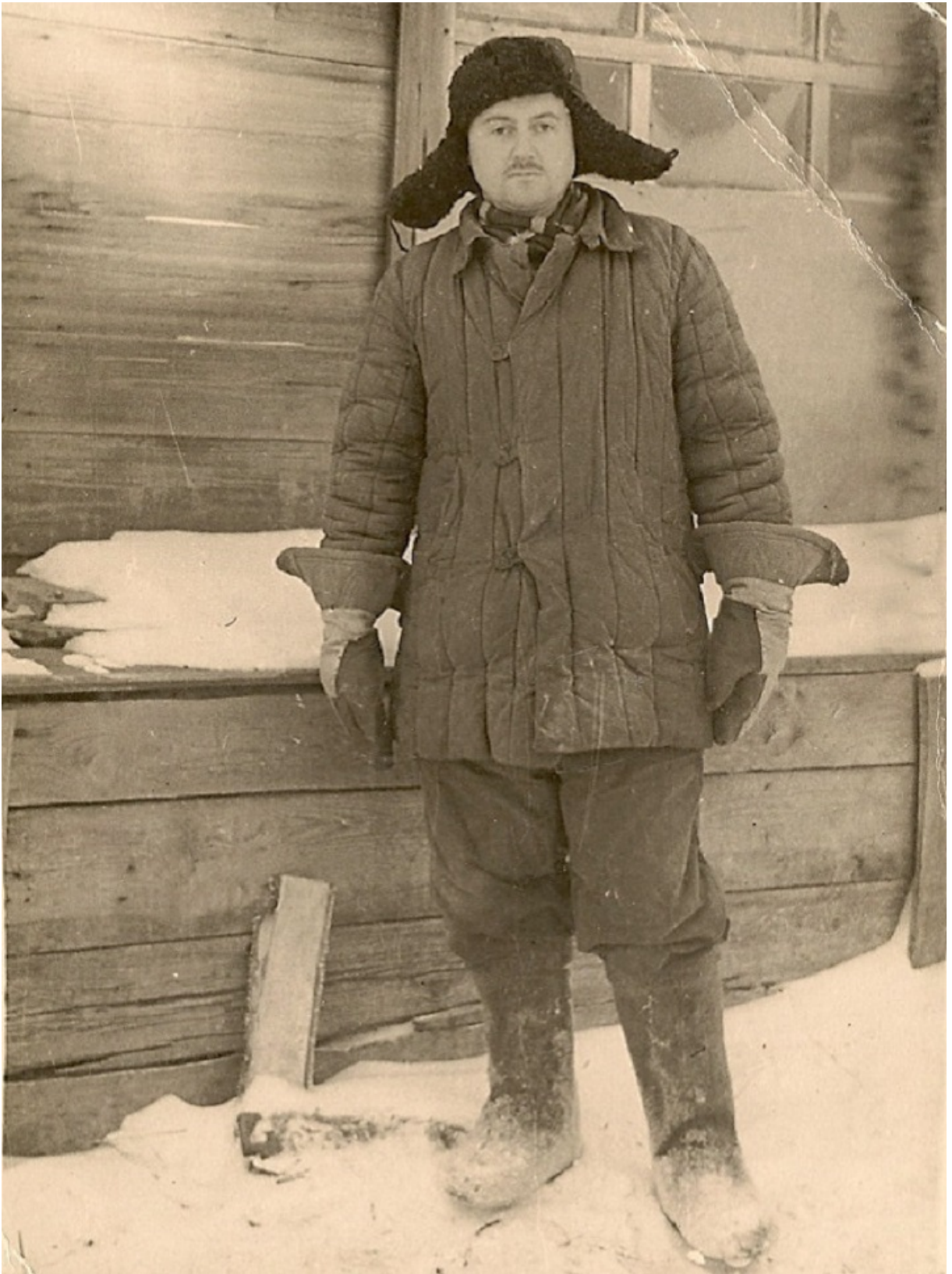
У мордовському таборі, 1960