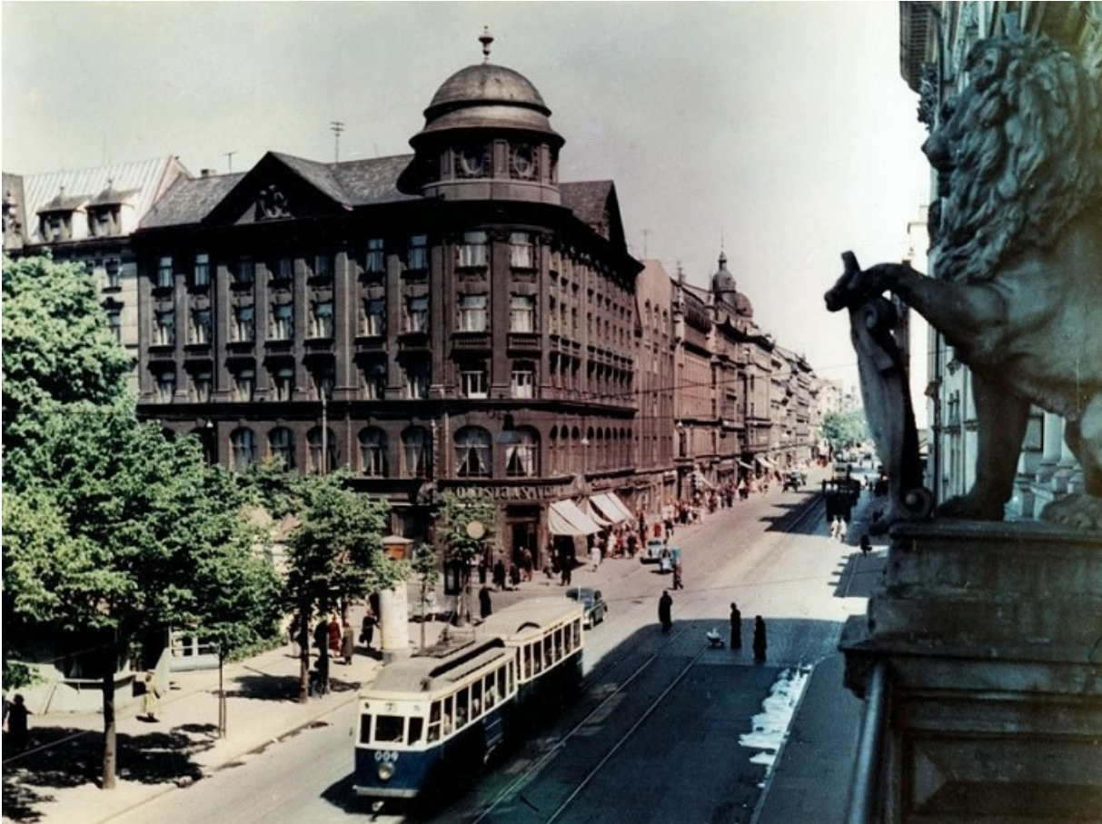
Рига, 1950-ті роки

Ночами Йосип слухав ізраїльське радіо — співробітники посольства повідомляли йому раз на три тижні, на якій хвилі ловити програму на їдиші. Після кожної передачі він із друзями випускав «бюлетень» новин, що розповсюджувався серед євреїв. Після однієї з таких передач, 23 квітня 1957 року, його взяли «на гарячому» — з останнім повідомленням інформації з Ізраїлю. Коли чекісти прийшли з обшуком до Шнайдера, то застали його в ізраїльській поліцейській формі — він одержав її в подарунок від дядька за день до арешту, а в його кишені лежала «Декларація Шолома Аша».