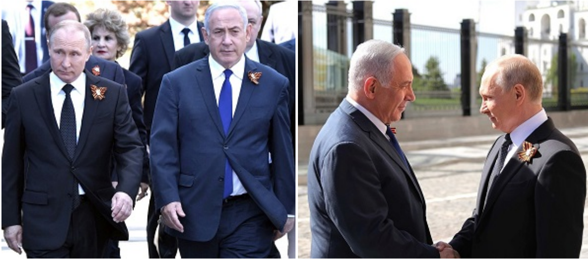
Премьер Израиля Нетаниягу с президентом России Путиным на Параде Победы

ухудшении отношений невозможно повернуть вспять. Четыре года ВВС Израиля и спецназ чувствовали себя на границе с Сирией абсолютно свободно. В какой-то момент этот аспект отношений с российским руководством достиг своего предела, но товар в виде неких договоренностей остался — он поставлен и возврату не подлежит.