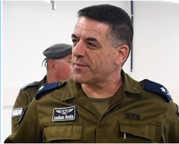
Главком ВВС Израиля Амикам Норкин

— И, наконец, вечная тема — сектор Газа. Результаты недавнего опроса, согласно которому 57% евреев-израильтян поддерживают переговоры с движением ХАМАС (даже среди правых таких 45%), — обескураживают. Отказ от переговоров с террористами на протяжении десятилетий был одним из краеугольных принципов израильской политики. Вектор общественных настроений столь сильно изменился?