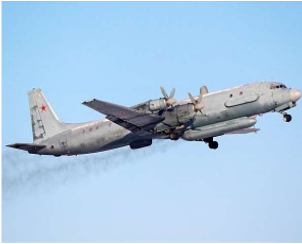
ИЛ-20 ВВС России