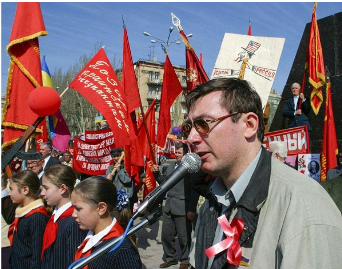
Юрий Луценко на митинге Соцпартии в Донецке, 2003

украинцем. Вполне допускаю, что это так, но мы же помним, что он говорил в 2003 году об УПА в Донецке, еще возглавляя областную организацию Социалистической партии Украины.