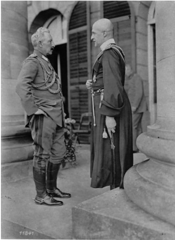
Император Вильгельм II и гетман Скоропадский, август 1918