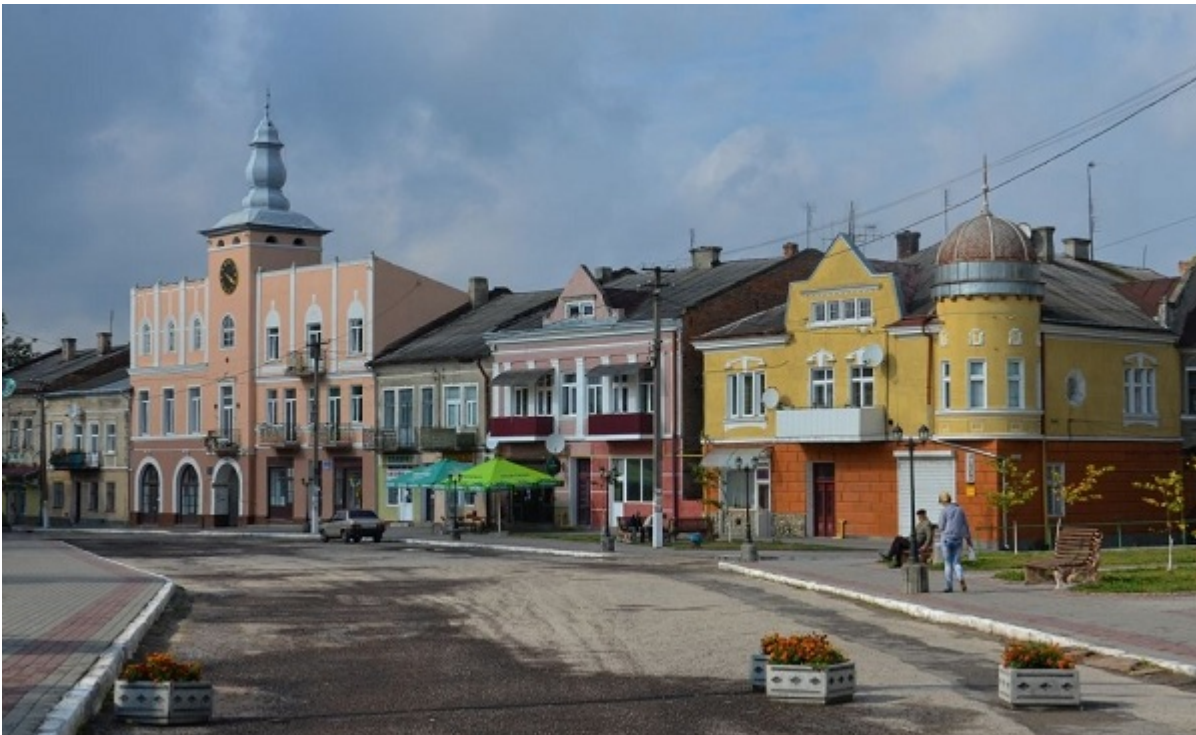
В центре городка