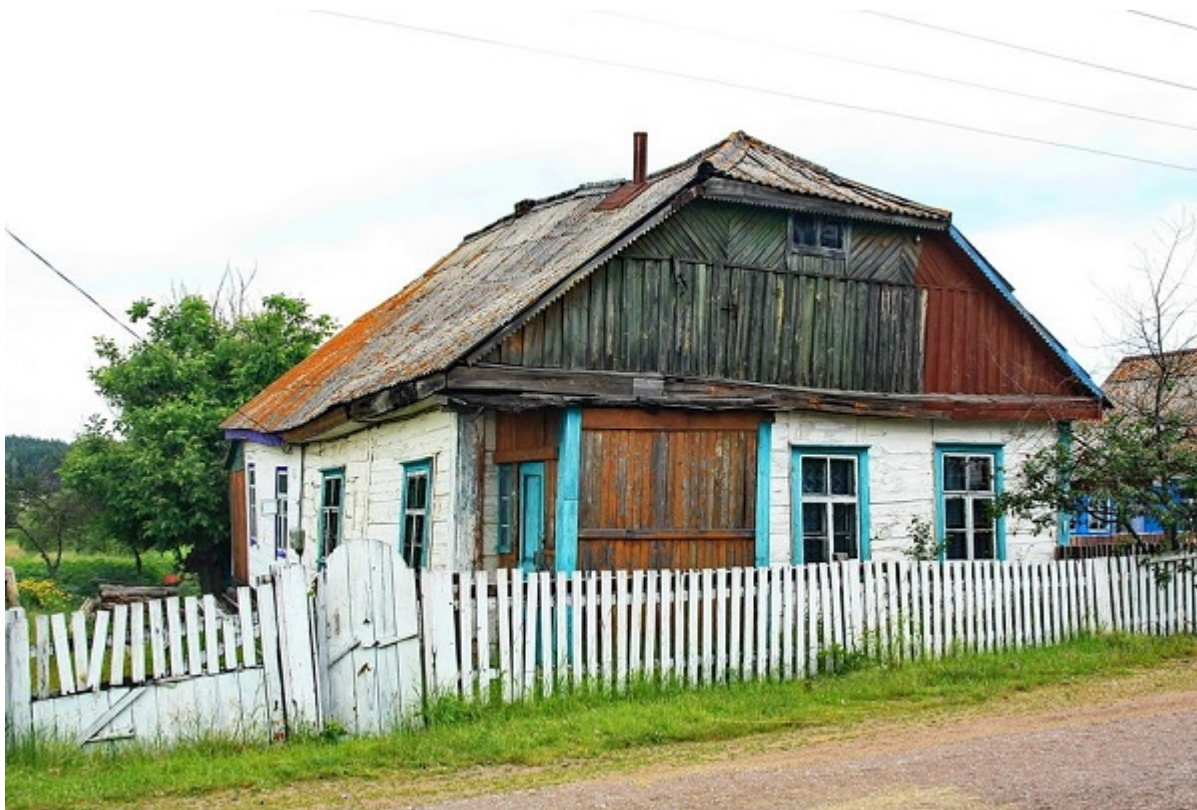
Бывший еврейский дом в Ушомире

«На другой день в Ушомире появилась группа вооруженных кавалеристов, которые отправились на базар и стали избивать встречных евреев, — пишет Гусев-Оренбургский. — У них был зверский вид, резко отличавшийся от прибывших раньше повстанцев-крестьян. Все бежали, кто куда мог. Но тут явились местные крестьяне и стали защищать евреев, спрашивая кавалеристов: «Зачем вы пришли?» «Расправиться с евреями», — отвечали те. Крестьяне просили не трогать ни одного еврея, поскольку те идут вместе с ними, а если тронут хоть одного, то погромщиков ждет расправа. Те стали отговариваться. «Мы пришли не для убийства евреев, а чтобы выловить снаряды, брошенные петлюровцами в реку». И вскоре скрылись».