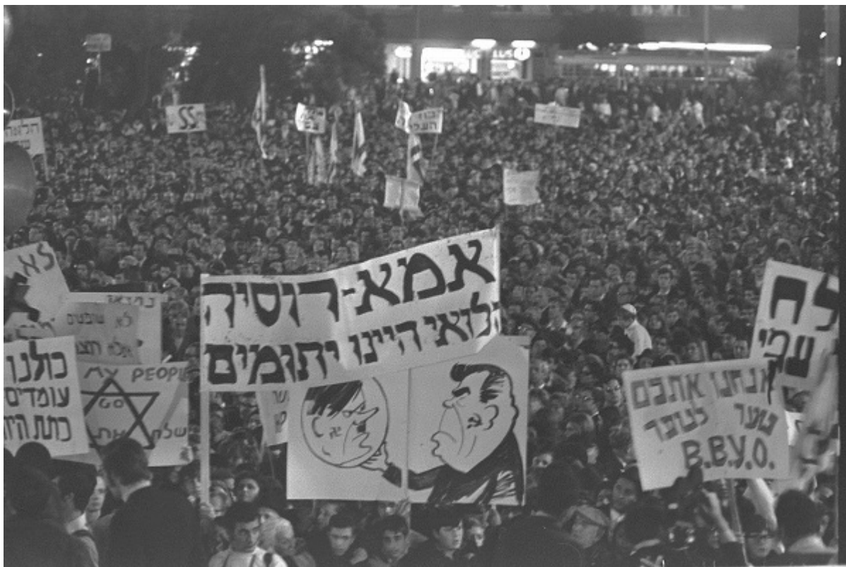
Демонстрация в Израиле в поддержку участников «Самолетного дела», 1971