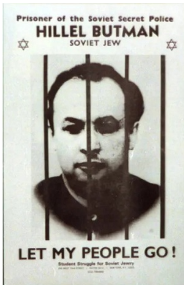
Постер одной из кампаний по освобождению Бутмана