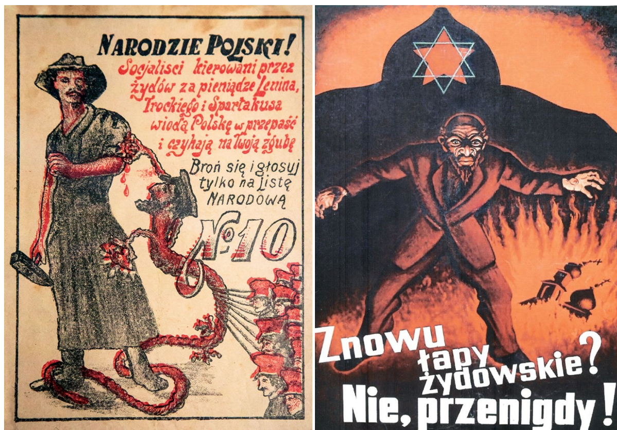
Примеры польской антисемитской пропаганды