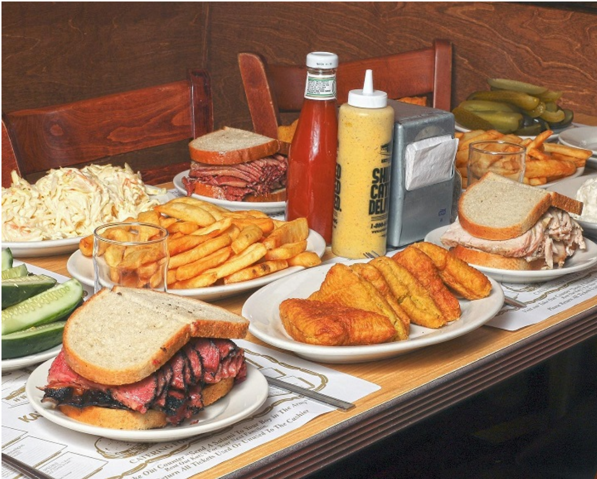
Типичное меню Katz's Delicatessen