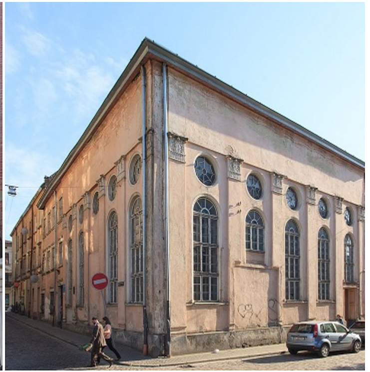
Синагога на Угольной, Львов

На первый взгляд, музей — это мертвая вещь. На самом деле это место, где бурлит общинная жизнь. Лидеров СJP интересовал не музей сам по себе, а то, что в «бывшей» синагоге стала собираться молодежь для неформальных служб. Они назвали себя « Хавура на холме ». Эти ребята могли бы найти другое место, но им было важно продолжить историю «Вильна Шул».