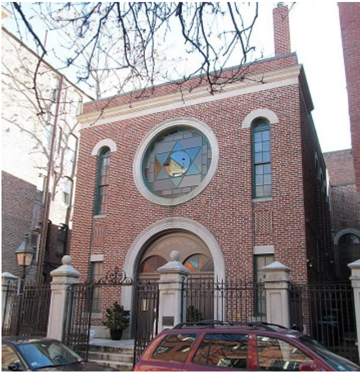
Здание «Вильна Шул», Бостон