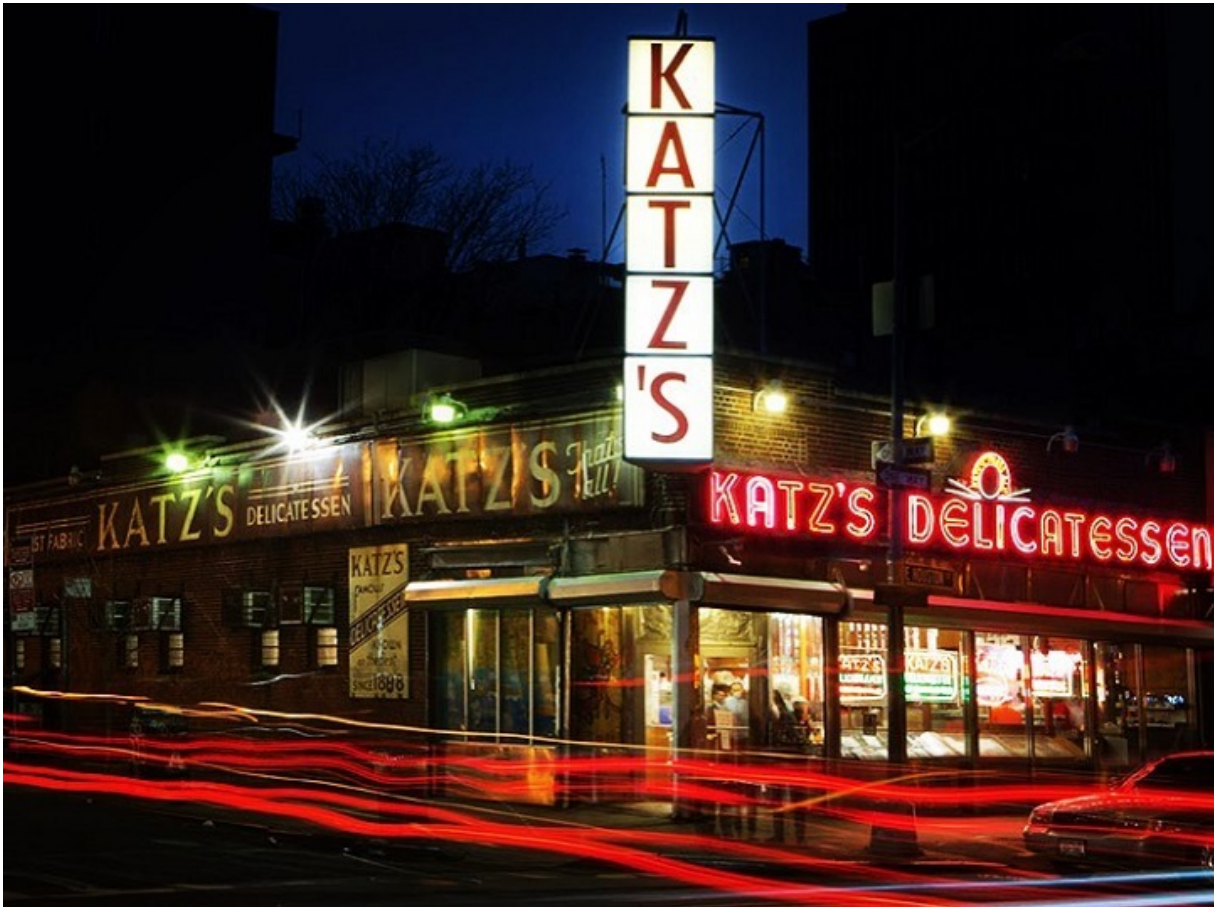
Знаменитая дели Katz's Delicatessen в Нью-Йорке

Спор о том, кого считать евреем, остается одной из самых горячих тем дискуссий и в США, и в Израиле, и среди русскоязычных евреев. Не менее актуален и вопрос, что представляет собой религиозный еврей? В Хабаде, например, полагают, что все евреи в той или иной мере религиозны. По Галахе, разумеется. Однако Израиль, Холокост и антисемитизм давно стали опорными пунктами национальной идентичности. Исследователи называют это светской религией евреев. По данным опроса Pew Research Center в то, что Бог Израиля дал евреям Землю Израиля верит в два раза больше американских евреев, чем в самого Бога. А что, если не только предписания ортодоксальной Галахи, но и вся еврейская активность — это тоже иудаизм?