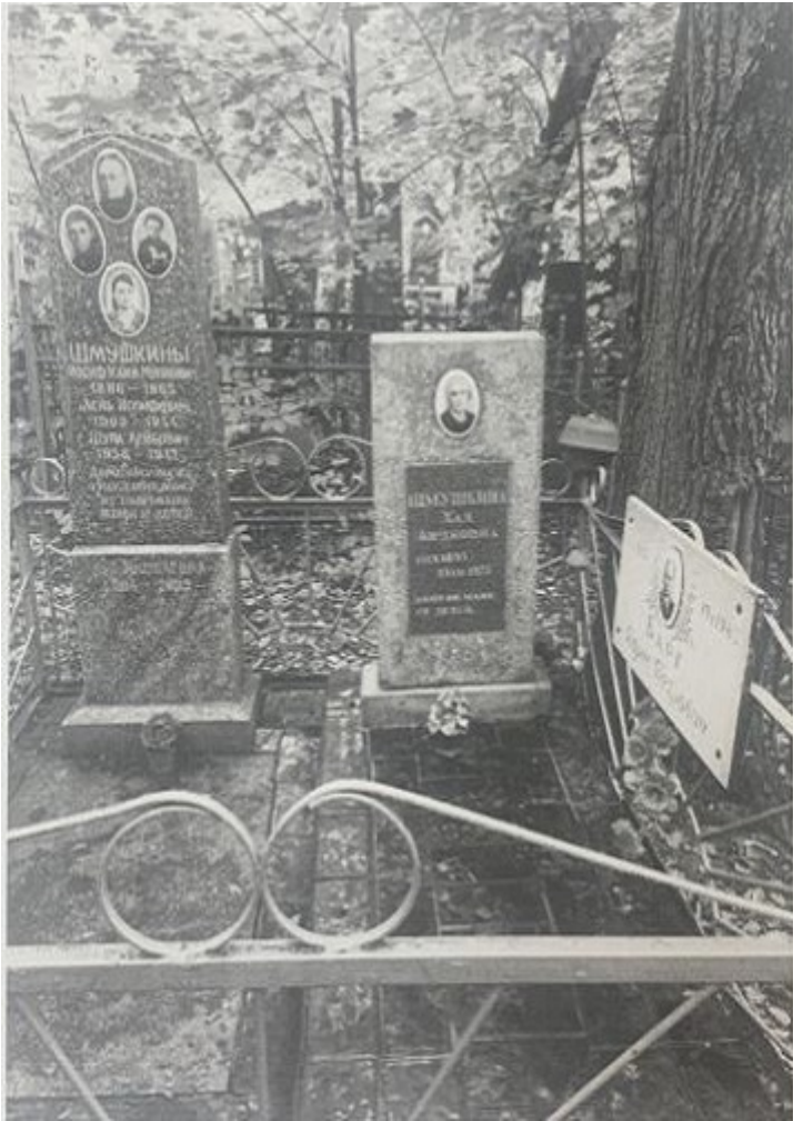
Могилы Шмушкиных на Берковцах