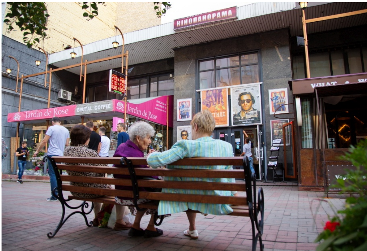
Кинотеатр «Кинопанорама» в здании бывшей Купеческой синагоги

Так или иначе, но таблицы Вайсблата получили широкое распространение в еврейском мире, что повлияло на решение предложить в 1902 году только что возникшую вакансию Главного духовного раввина Киева моему прадеду.