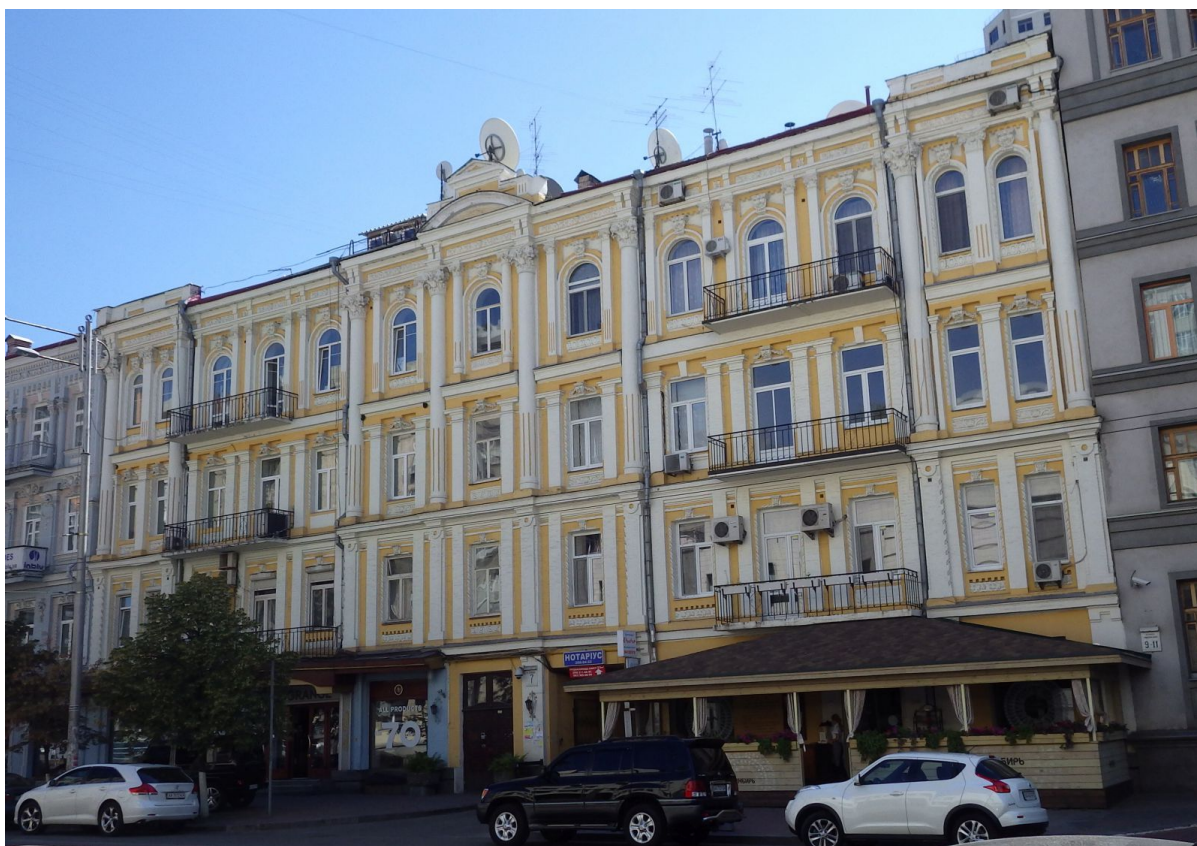
Дом по улице Жилианской, в котором жил главный раввин Киева