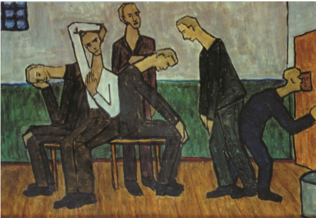
«В камере», худ. И.Вайсблат

14 мая 1951 года. Начат в 22.00, окончен в 8.30