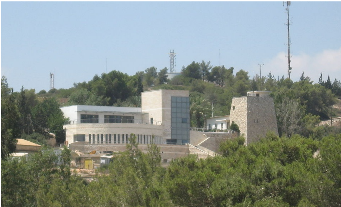
Иешива в Маале Гильбоа

У нас нет будущего в отрыве от иудаизма. Поэтому нам важен каждый еврей, возвращающийся домой во всех смыслах этого слова. Но я оптимист, потому что вижу, что нынешнее израильское общество более еврейское, чем когда бы то ни было.