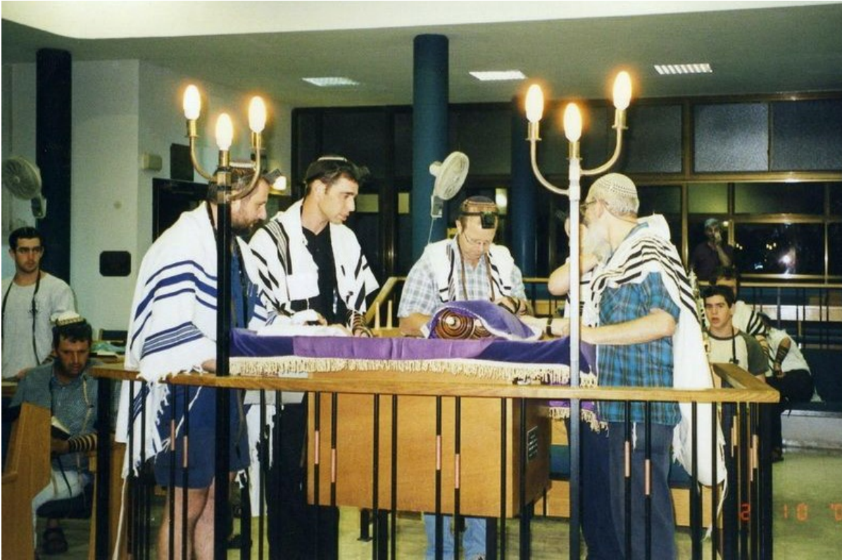
Молитва шахарит в кибуце Лави

Эмуним. Это места, где жили наши праотцы. Мои лучшие друзья живут в Иудее и Самарии, я сам жил в Алон-Швуте, семьи моих сестер — в Гуш Эционе. Поселенцы — одна из лучших частей израильского общества.