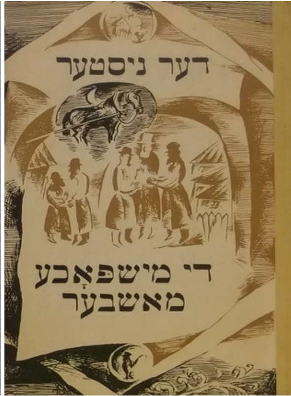
Дер Нистер и его роман «Семья Машбер»