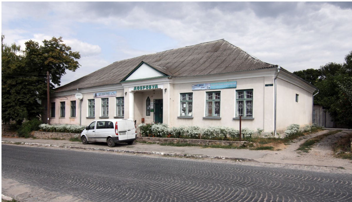
Это здание горожане принимают за синагогу

Поселок Микулинцы, что на Тернопольщине, известен, главным образом, как родина замечательного пива «Микулин». К сожалению ценителей, продается оно исключительно в Западном регионе, но кто пил, — оценил. Это была не реклама, а приятные воспоминания.