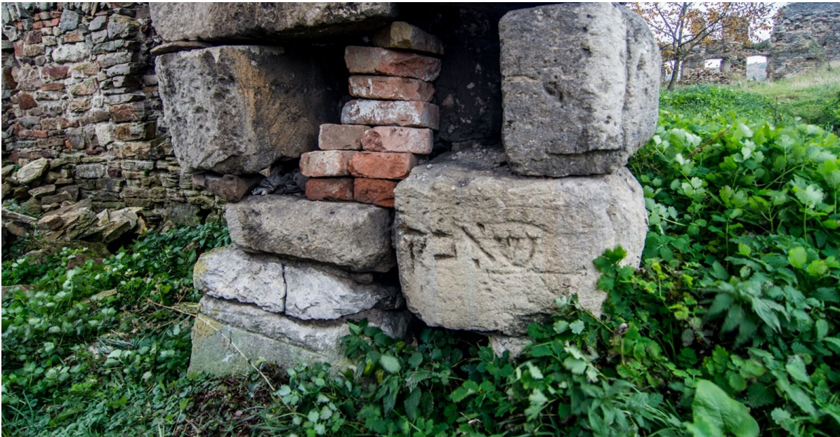
«Еврейский» камень (справа) на руинах замка