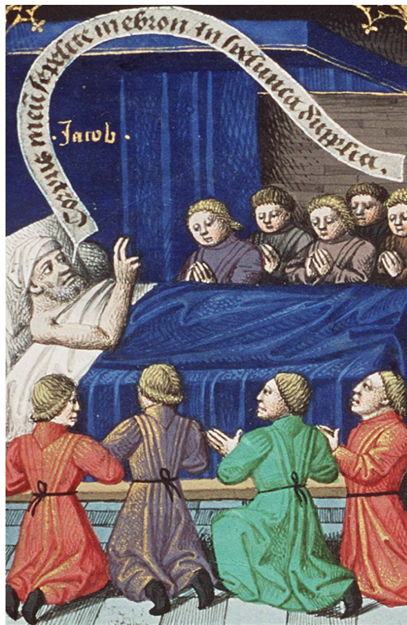
Яков благословляет своих сыновей

Незадолго до смерти благословляя своих сыновей, Яков напомнил первенцу Реувену о грехе, который тот совершил, усмотрев в поведении отца оскорбление своей матери. За это отец лишил своего первенца права