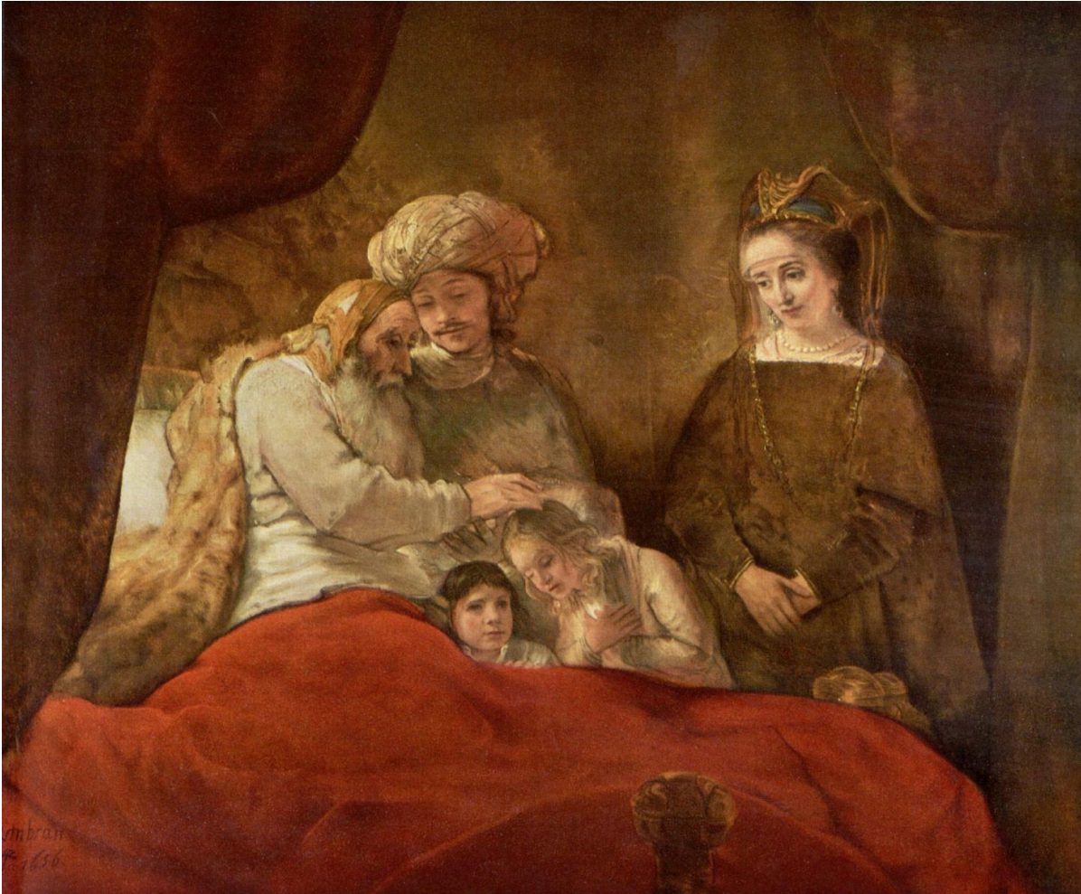
«Яков благословляет Эфраима и Менаше», худ. Рембрандт Харменс ван Рейн, 1656

Будь сильным — и люди к тебе потянутся (из руководства по перетягиванию каната)