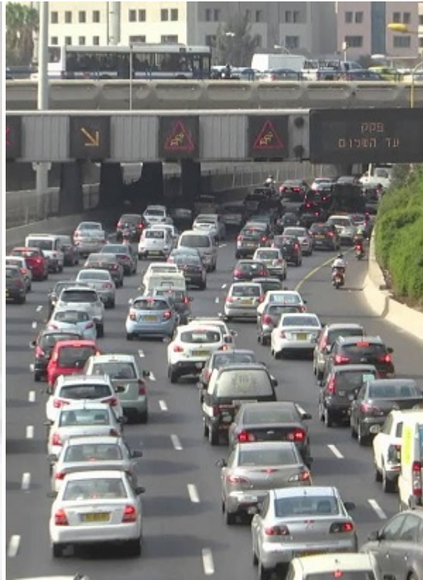
Пробка в Тель-Авиве

Исследование показало, что потребительские цены в Израиле на 28% выше, чем в США, и на 66% выше, чем в ОЭСР в целом. Тель-Авив и Иерусалим входят в пятерку самых дорогих городов в развитом мире, причем Тель-Авив уступает лишь Лондону.