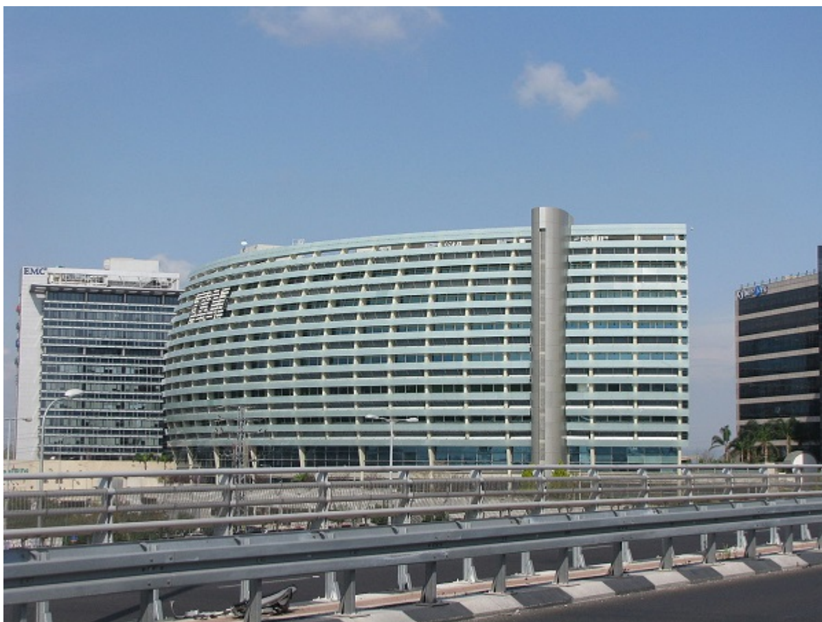
Комплекс IBM в Петах-Тикве