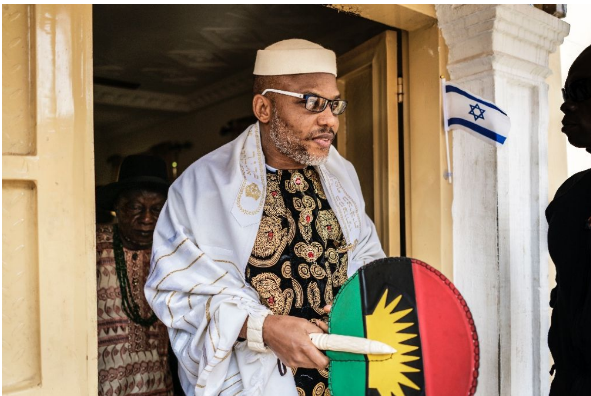
Лидер IPOV Ннамди Кану

Американский еврейский конгресс даже сравнил положение игбо с прошлыми гонениями на евреев, израильский Красный Крест поставлял им продукты и предметы первой необходимости, а правительство Израиля снабжало оружием.