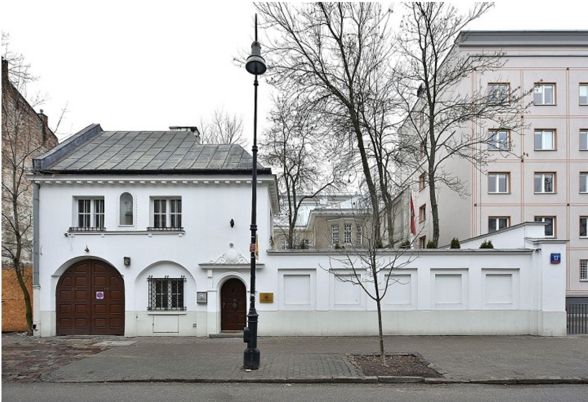
Будинок по вул. Емілі Платер, 17, Варшава