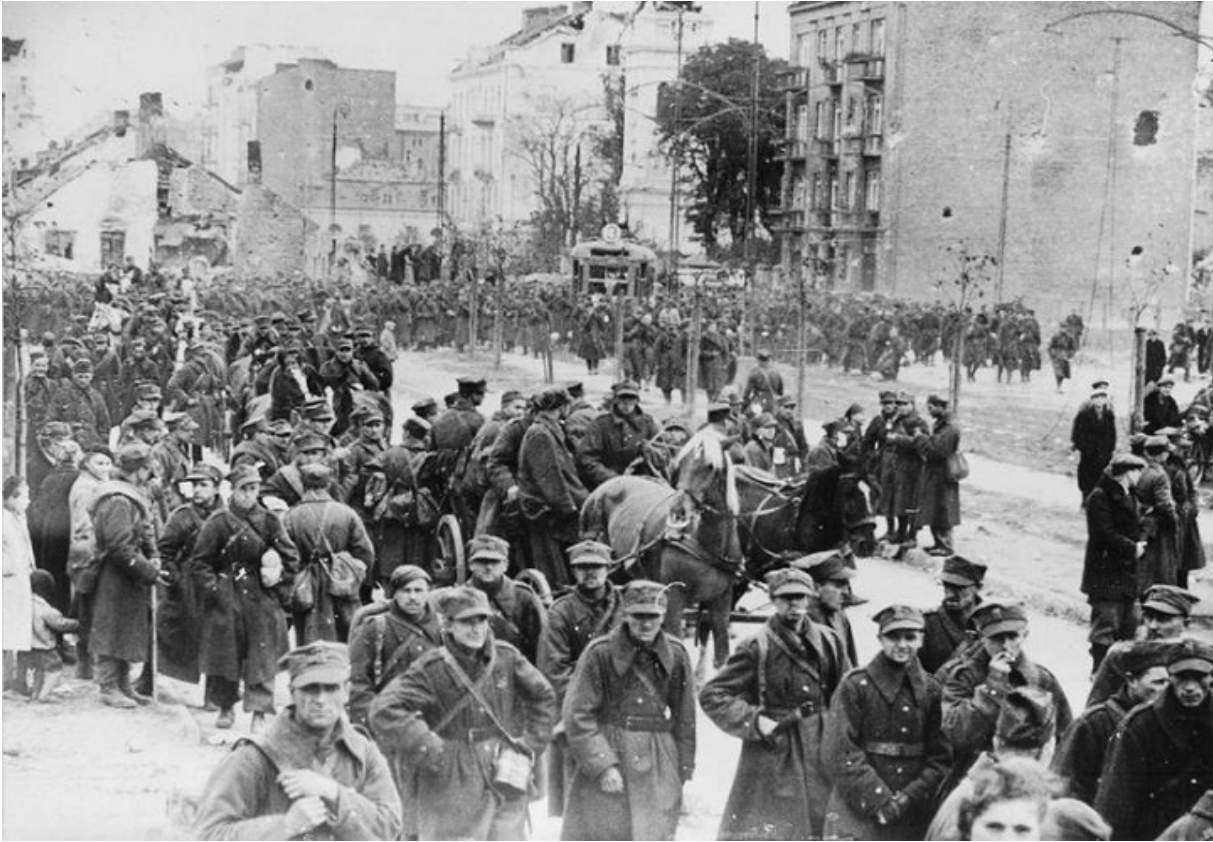
Польські солдати, полонені вермахтом