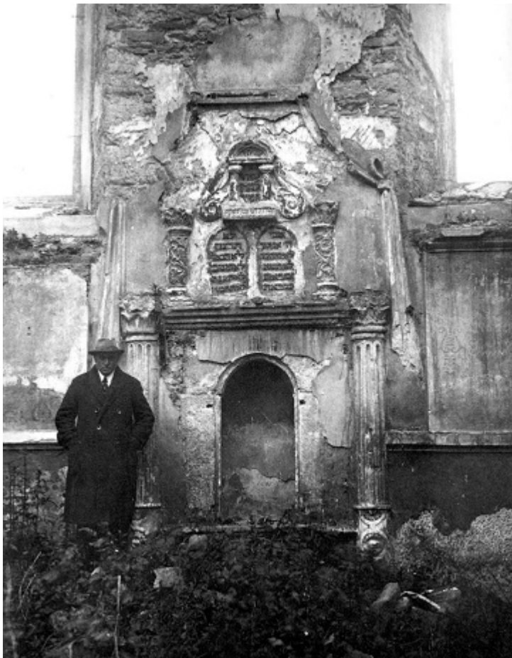
Арон-кодеш синагоги, 1920-е