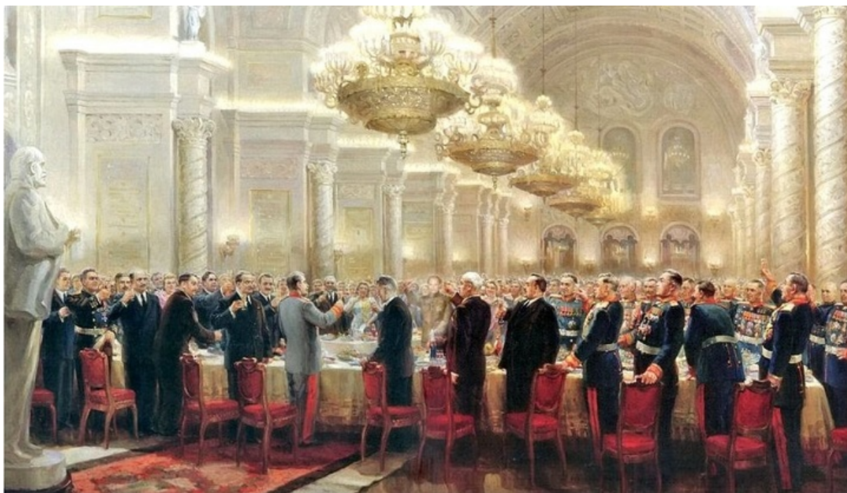
«За великий російський народ», худ. Михайло Хмелько, 1947 рік