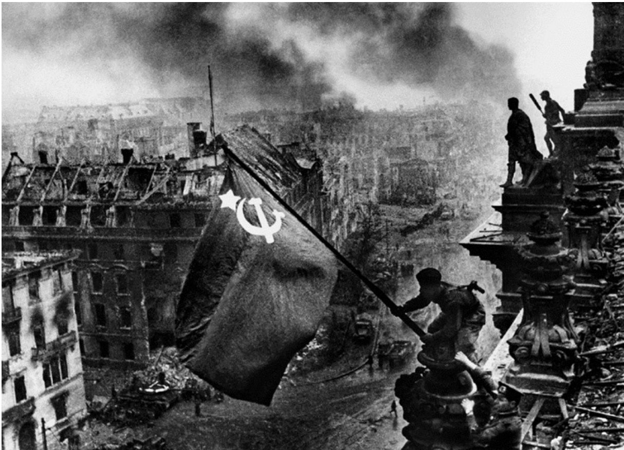
«Прапор перемоги над Рейхстагом».

Символами перемоги союзників у Другій світовій війні стали два фото: червоний прапор над напівзруйнованим Рейхстагом у Берліні і група американських солдатів, що встановлюють американський прапор на Іводзімі. Автор першого знімка — уродженець Юзівки Євген Халдей. Під час єврейського погрому 13 березня 1918 року були вбиті його мати (при спробі захистити сина) і дід, а сам однорічний Женя дістав кульове поранення в груди. У 13 років прийшов на завод, тоді ж захопився фотографією і в 16 став фотокором. З 1939 року Халдей — кореспондент «Фотохроніки ТАСС». За чотири роки війни пройшов зі своєю камерою від Мурманська до Берліна. В історію увійшли його кадри з конференції в Потсдамі й підписання акту капітуляції Німеччини. Фотографії Євгена Халдея були представлені в якості речових доказів на Нюрнберзькому процесі.