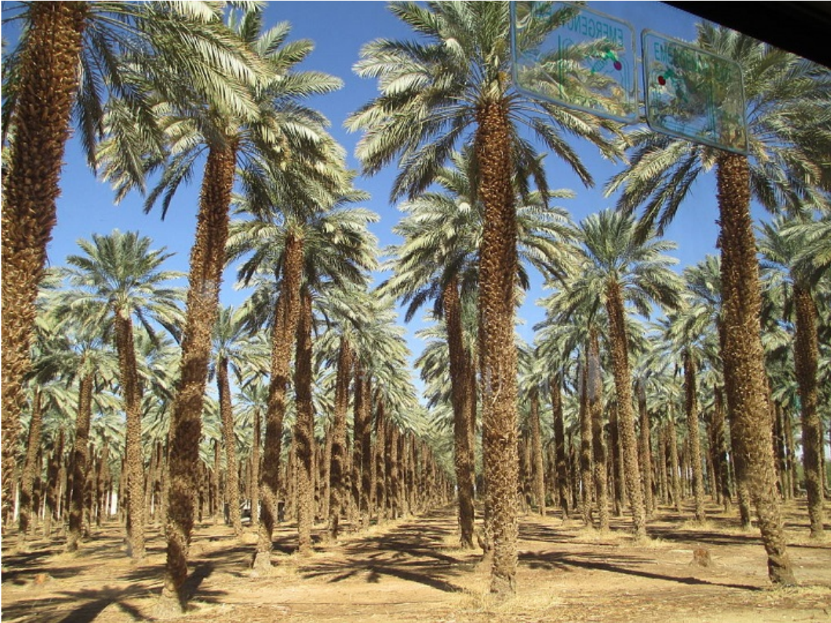
Фініковий гай у кібуні Кетура

Сьогодні фініковий гай — невід'ємна частина ізраїльського пейзажу. Але ще сто років тому ці дерева можна було побачити хіба що в садах арабських шейхів, і зрідка в оазисах пустелі Арава. При тому, що в стародавній Юдеї фініки були дуже поширені, до XVI століття їх плантації в Ерец Ізраель практично зникли.