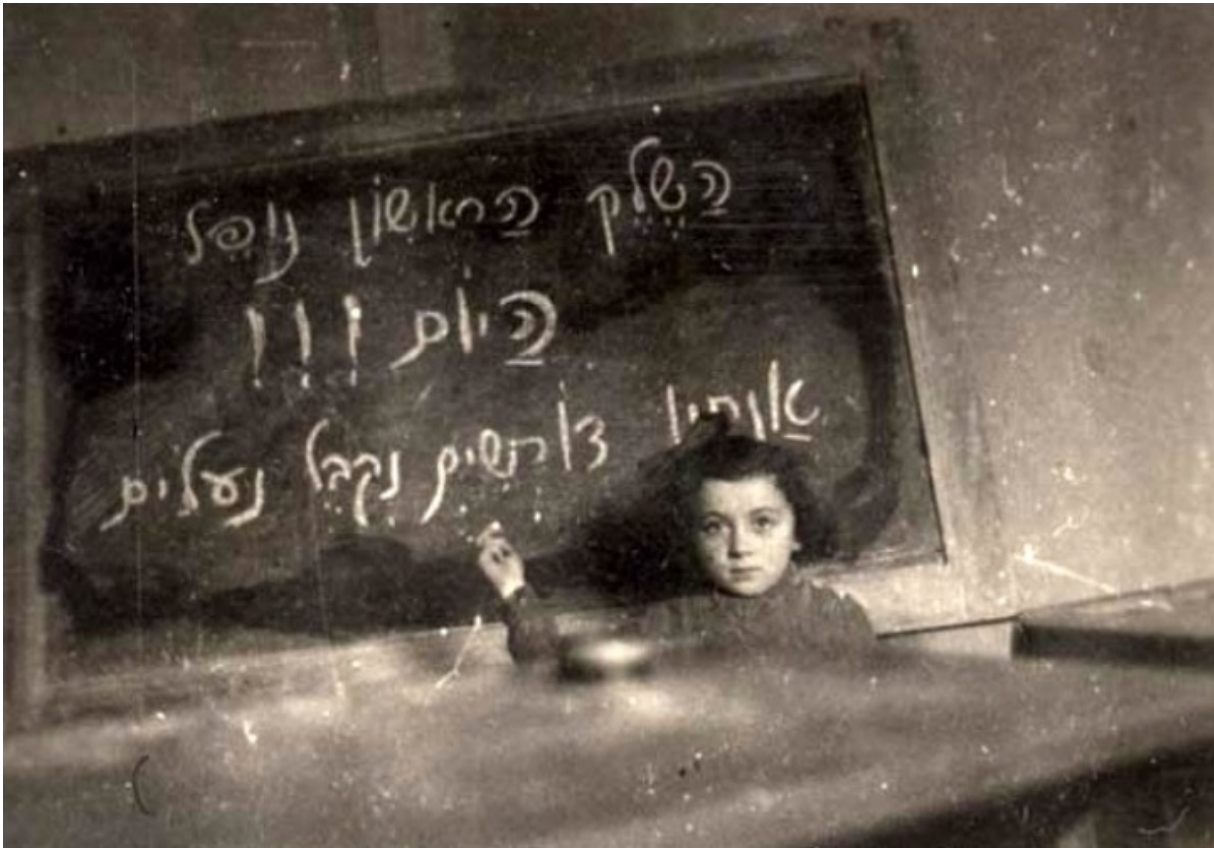
Урок иврита в лагере для перемещенных лиц, Берген-Бельзен, архив "Яд Вашем"

Легальные сионистские партии в Будапеште, Бухаресте, Праге или Софии открыто призывали к созданию еврейского государства в Палестине и боролись за право на свободную эмиграцию. Репатриацию ограничивала британская Белая книга от 1939 года, поэтому многие эмигранты пытались попасть в Эрец Исраэль нелегально. До 1948 года примерно 250 тысяч переживших Холокост евреев застряли в лагерях для перемещенных лиц в оккупационных зонах Германии и Австрии.