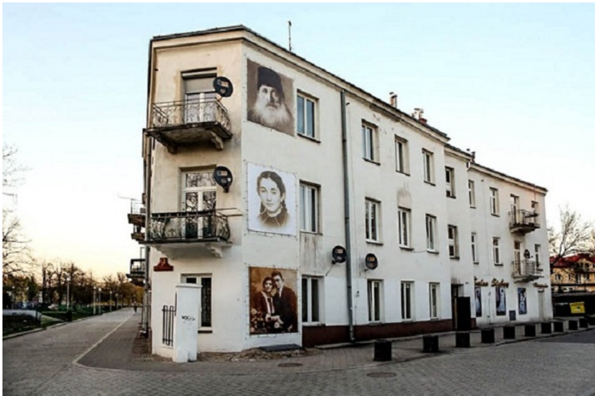
Дом №7 на улице Плантаы с фотографиями убитых здесь евреев, Кельце, 2000-е годы

В свидетельствах, написанных на разных языках, звучат похожие зловещие истории о возвращении евреев в родные края. От Киева до Праги звучал вопрос удивленных соседей: «Ты что, жив?» или страшная фраза о «незаконченной работе Гитлера».