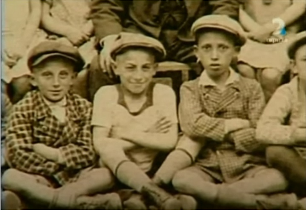
Кадр из фильма Душана Гудеца «Возлюби ближнего своего»

В августе 1946 года антиеврейские выступления начались в Братиславе. До 1948 года в Словакии убили как минимум 36 евреев. В Венгрии евреев обвиняли в спекуляции и ритуальных убийствах. Кроме того, там опасались выдвижения евреями имущественных претензий (эта тема звучит в фильме Ференца Тёрёка «1945»). В мае 1946 года в деревне Кунмадараш были убиты двое и ранены 15 евреев. Все началось со слуха, что евреи крадут христианских младенцев и делают из них колбасу. Летом 1946-го в Мишкольце толпа убила двух евреев.