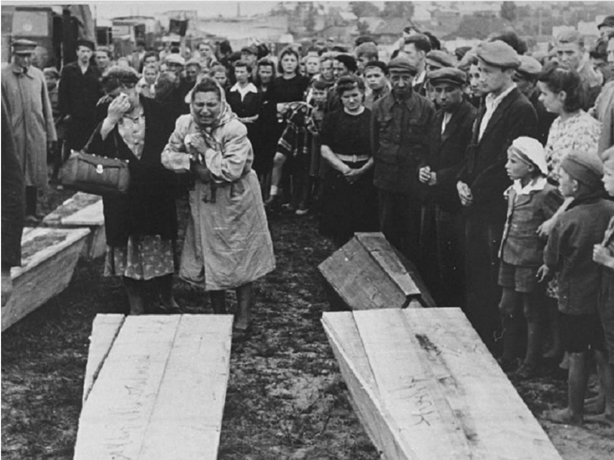
Похороны жертв погрома в Кельце

В мае 1945-го по Европе прокатилась волна ликования по поводу окончания войны. Фоном эйфории служили руины, скорбь и чувство опустошенности.