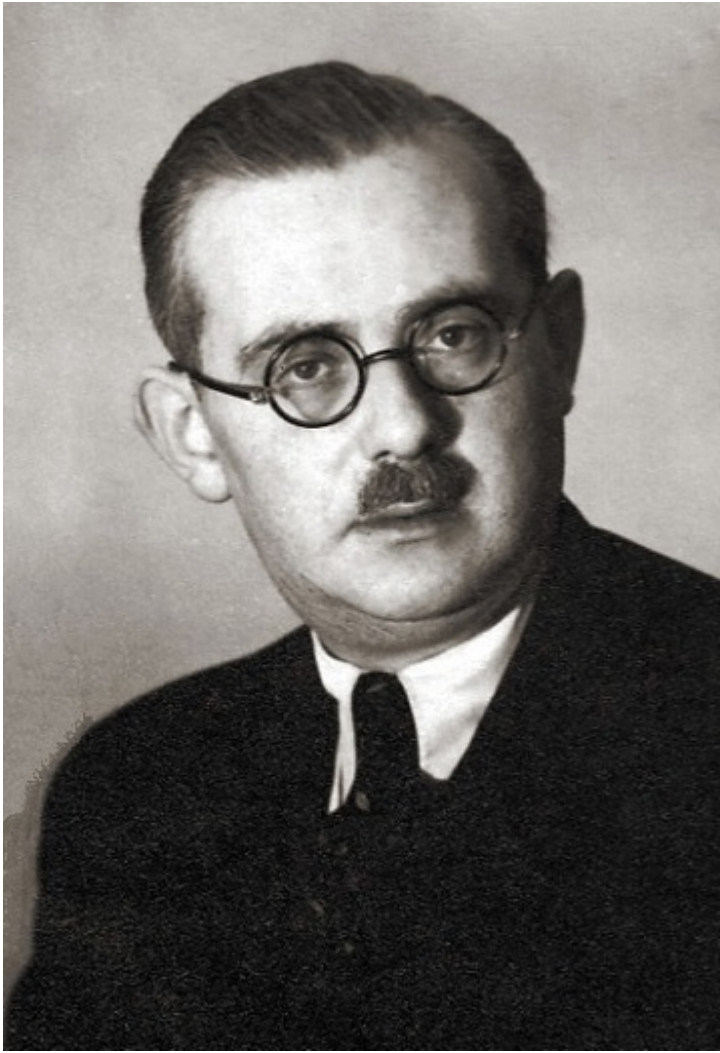
Председатель Госплана ПНР Хиллари Минц