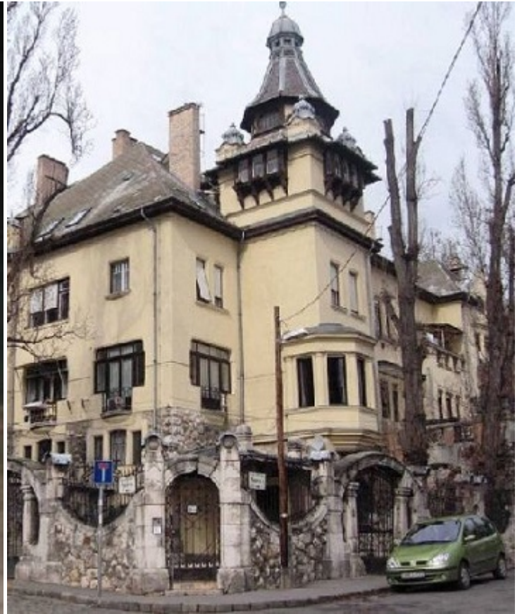
Будівля шведської місії, звідки Валленберг керував операцією з порятунку євреїв.

Це було б неможливо без Пала Салаї — старого приятеля Каро з руху бойскаутів. У 1939-му Салаї добровільно вступив у пронацистську Партію схрещених стріл, але незабаром під впливом Сабо порвав з фашистами, що не завадило зробити йому непогану кар'єру в поліції.