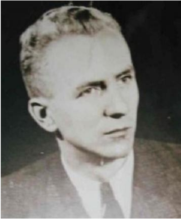
Карой Сабо, 1944