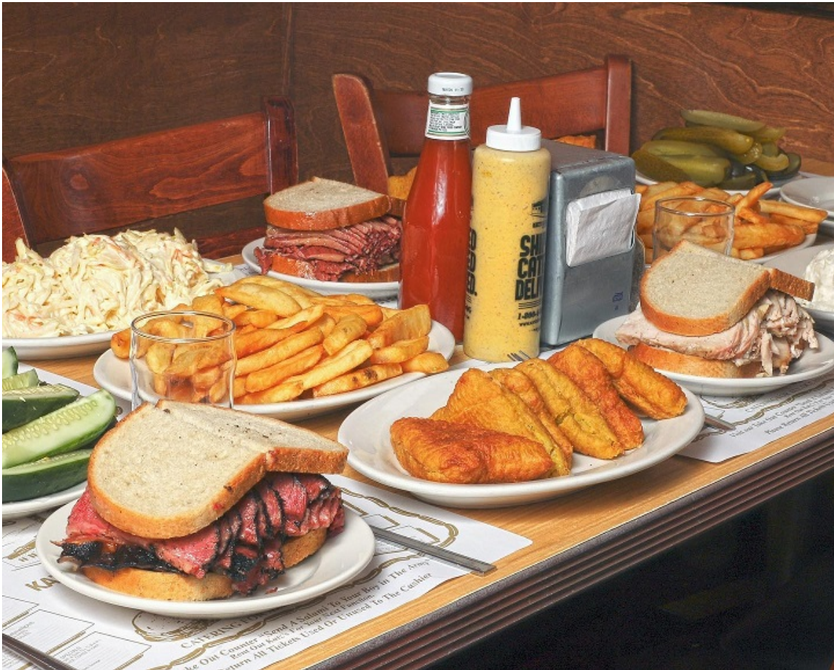
Типове меню Katz's Delicatessen