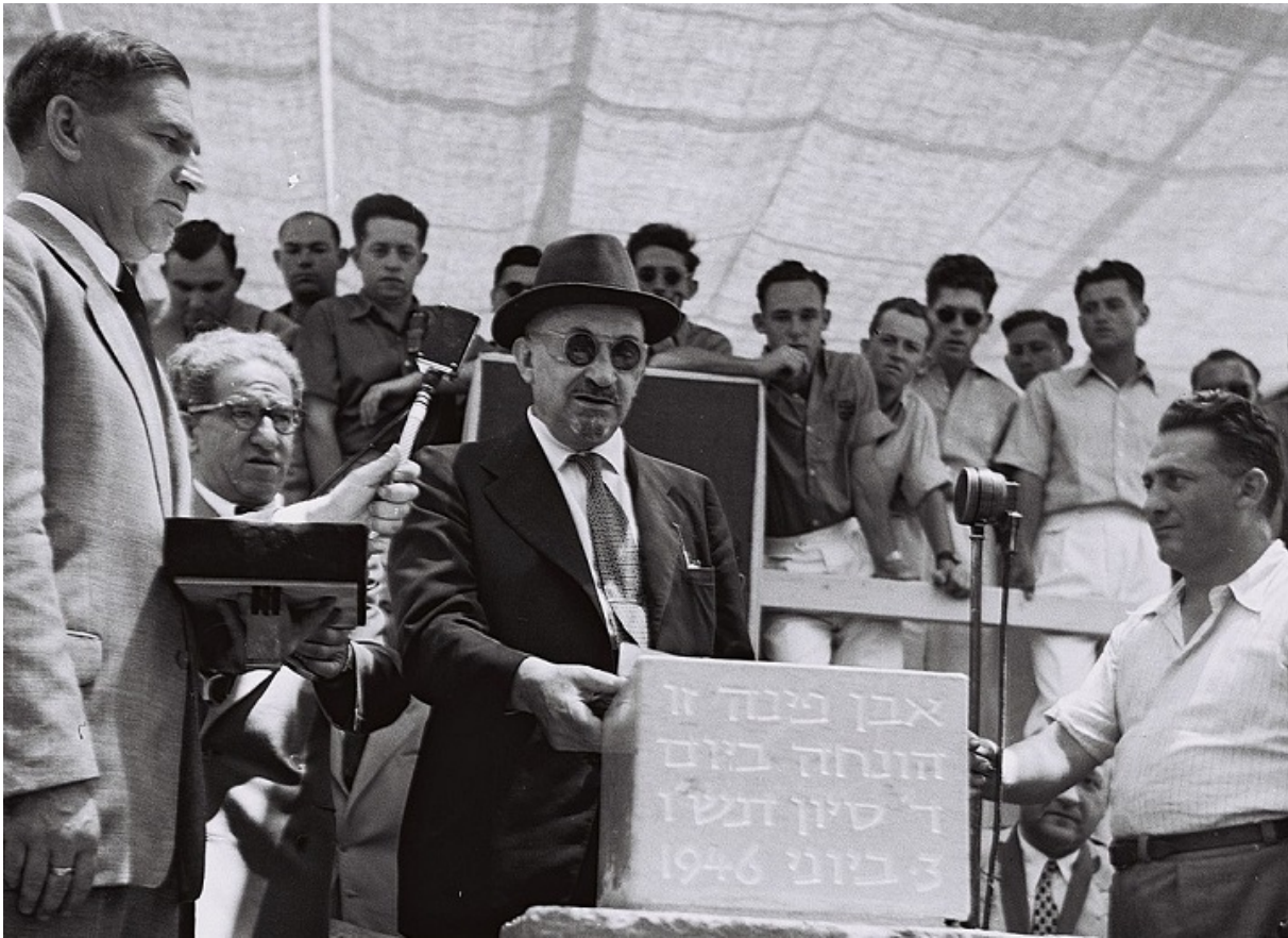
Хаїм Вейцман закладає наріжний камінь в основу майбутнього науково-дослідного інституту свого імені, 1946

У дусі часу справу Вейцман спробували пов'язати і з процесом Єврейського антифашистського комітету. Мовляв, Марія Евзорівна у своїй злочинній діяльності керувалася ворожими установками, отриманими головою ЄАК, режисером Соломоном Міхоелсом, від її брата Хаїма Вейцмана.