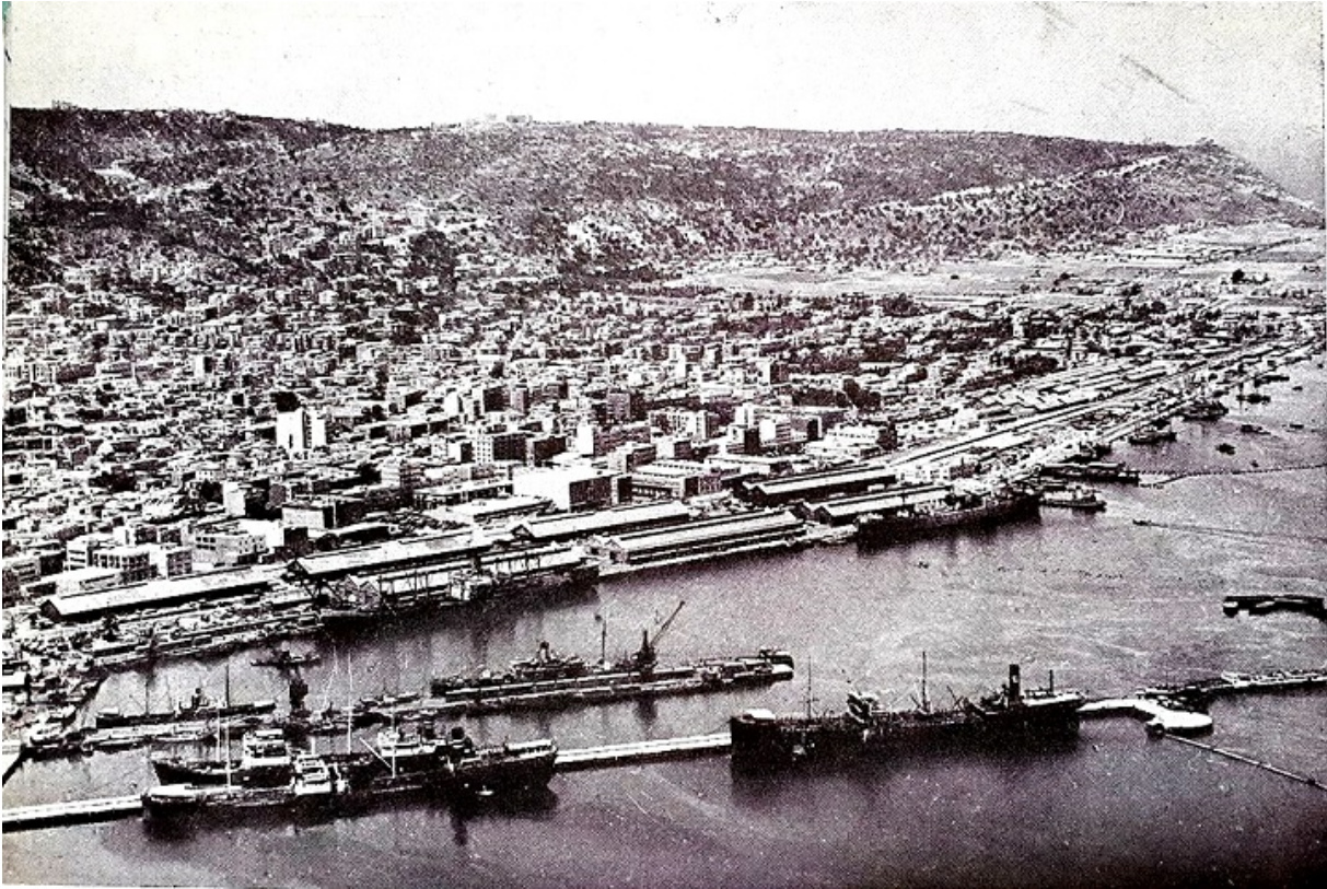
Порт Хайфи, 1950-і

11 лютого 1956 року Марія Евзорівна з Василем Савицьким прибули в порт Хайфи. На борт корабля «Хадар» зустріти тітку піднявся племінник Езер Вейцман, на той момент командир авіабази Рамат Давид, згодом головком ВПС, міністр оборони і президент країни. У порту подружжя урочисто зустрічали й інші члени родини, у тому числі Ганна Вейцман.