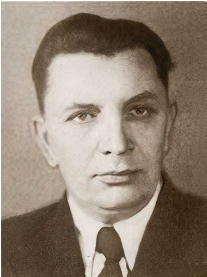
Міністр держбезпеки Семен Ігнат'єв

Під час війни працювала за фахом на авіаційному заводі № 4, а з 1944 року за сумісництвом — у Держстраху. У 1948 році вона вийшла на пенсію, але роботу не покинула: як і раніше лікувала людей.