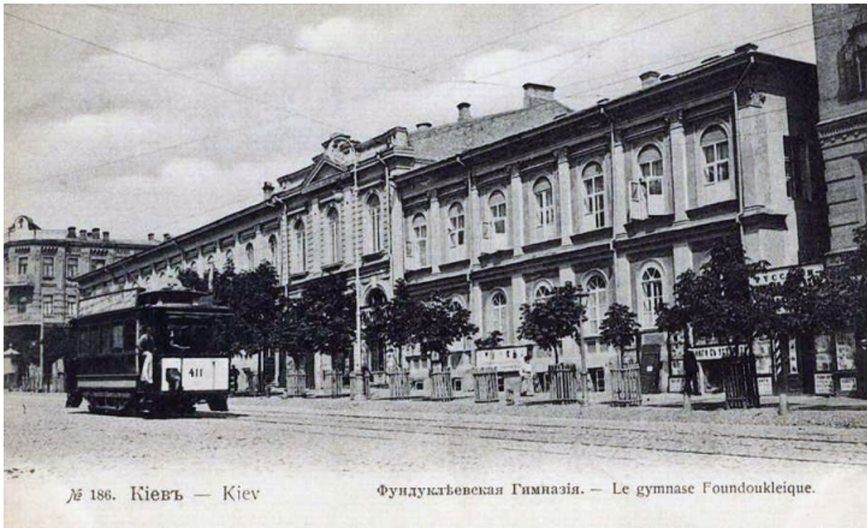
Фундукліївська жіноча гімназія