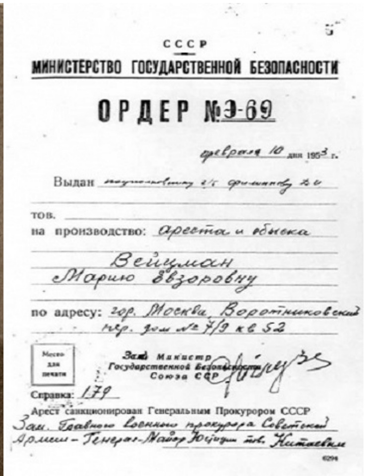
Ордер на арешт Марії Вейцман