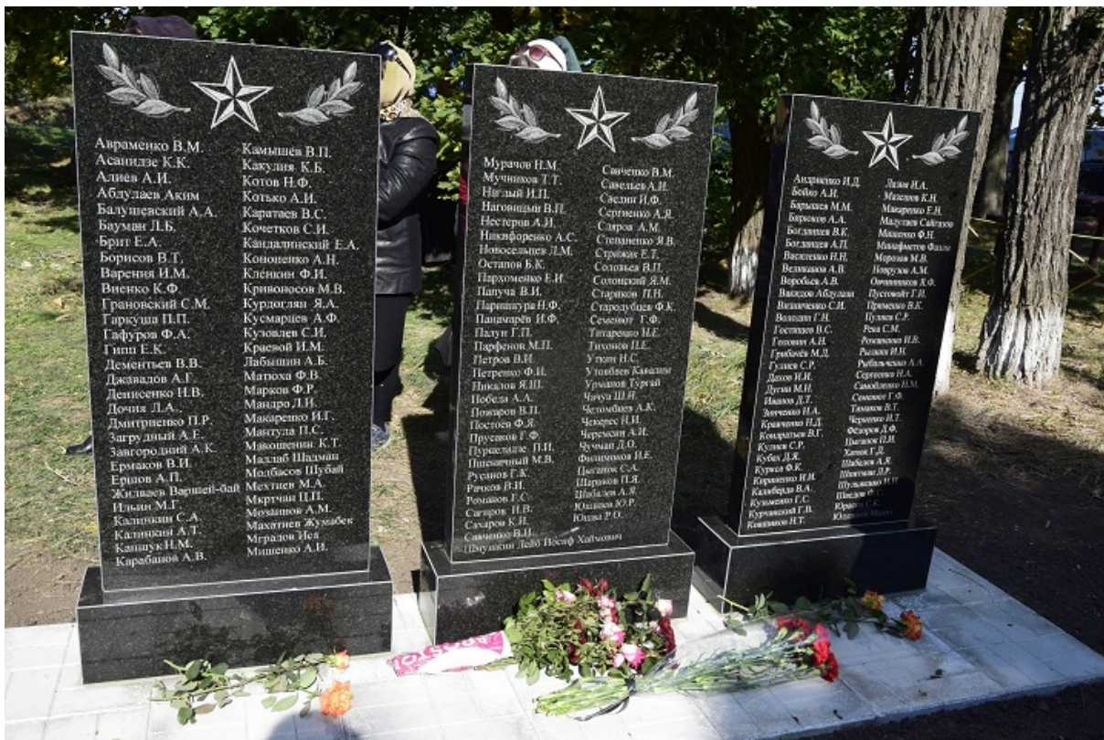
Стели полеглим воїнам у селі Заповітне