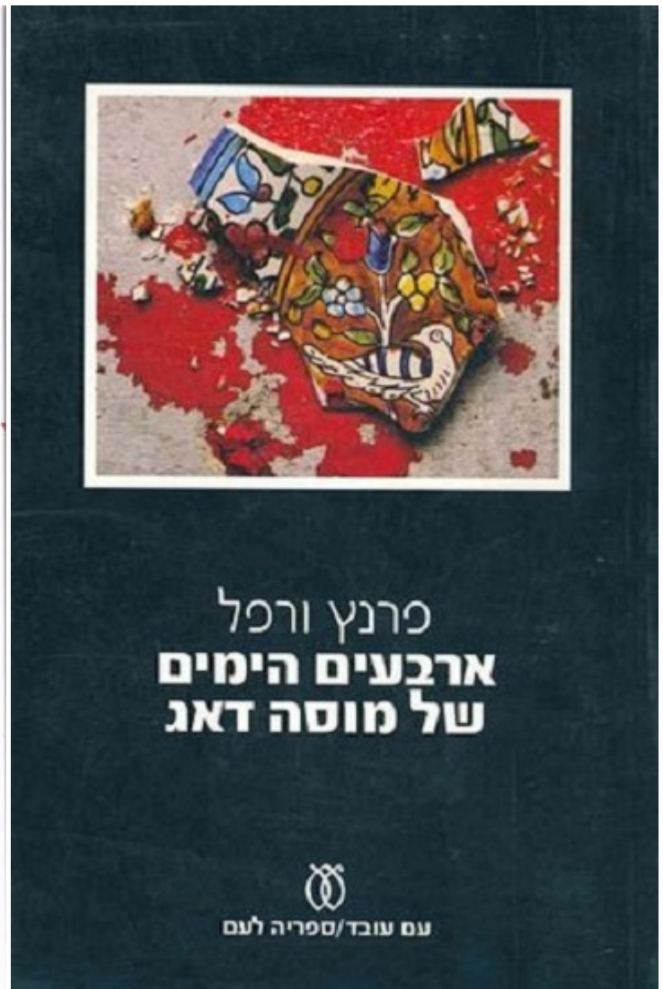
«40 днів Муса-Дага»

Єврейський ішув у Палестині готувався героїчно загинути, відбиваючи навалу військ Роммеля. Приклад вірменів, які стали на захист своїх сімей у Муса-Дазі, надихав палестинських євреїв. Колись книга Верфеля входила до програми ізраїльських шкіл, і наврядчи хтось міг собі уявити, що юнаки, які читали в юності «Муса-Даг», ставши політиками та дипломатами, всіляко підтримуватимуть турецькі спроби заперечення вірменського геноциду.