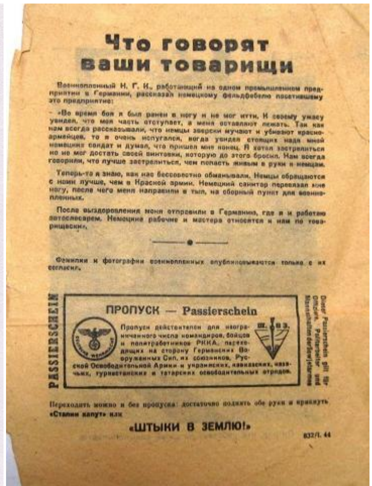
Німецька листівка, знайдена у Штрейкера