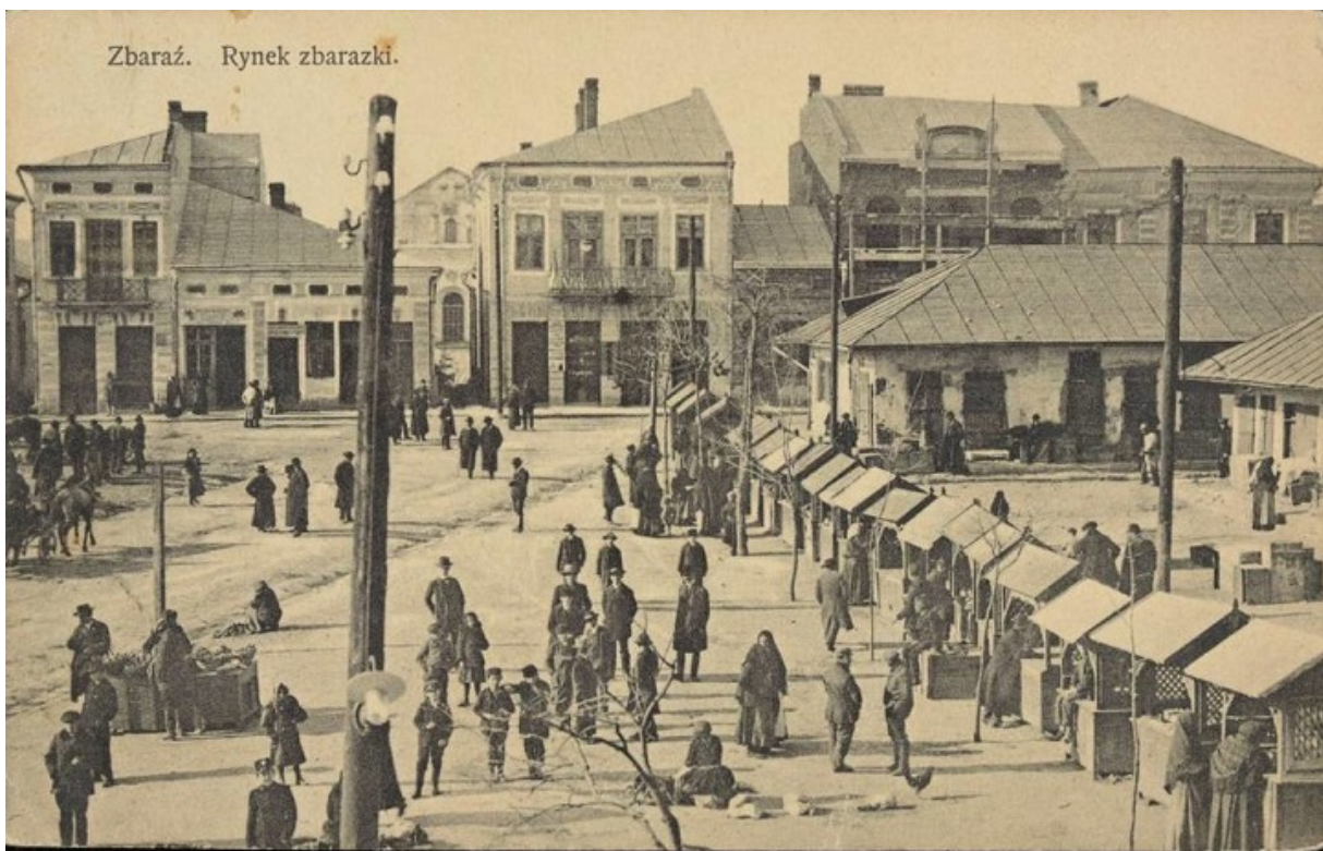
На ринковій площі Збаража.