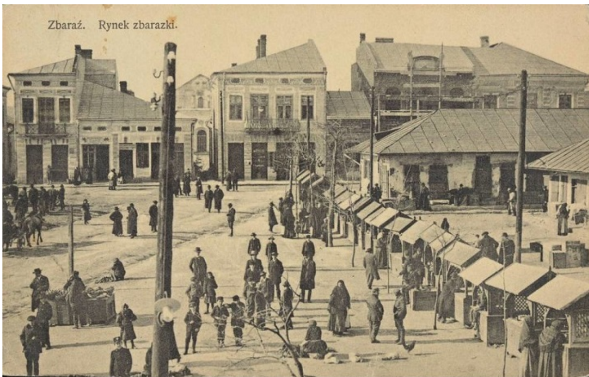
На ринковій площі Збаража.