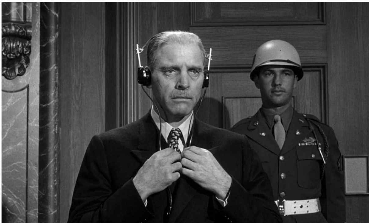
Берт Ланкасер в роли Эрнста Яннинга

На роль бывшего министра юстиции фашистской Германии Эрнста Яннинга Крамер пригласил Берта Ланкастера. И Ланкастеру, благодаря его неистощимому темпераменту и пластической выразительности удалось создать образ человека незаурядного, фанатически убежденного, но, в конце концов, осознающего чудовищную преступность дела, которому он служил.