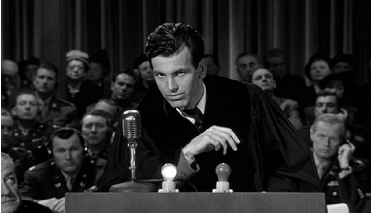
Максимиллиан Шелл в роли Рольфа

До появления в зале свидетелей Рольф, убежденный в том, что его подзащитным несправедливо инкриминируют злодеяния, за которые несет ответственность политическое руководство Третьего рейха, страстно и весьма убедительно защищает обвиняемых.