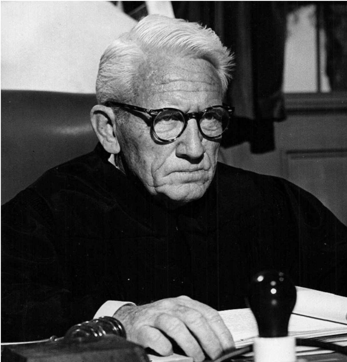
Спенсер Трейси в роли судьи Хейвуда

60 лет назад, 14 декабря 1961 г., в Западном Берлине состоялась премьера фильма «Нюрнбергский процесс».