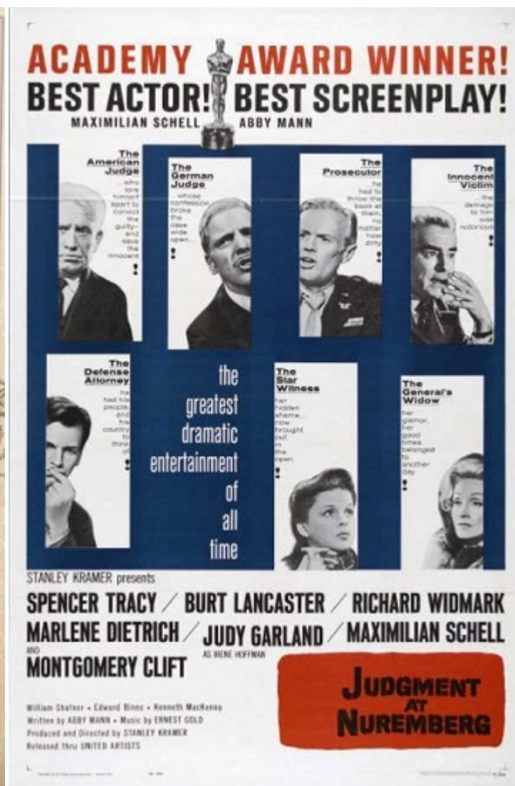
Постеры фильма «Нюрнбергский процесс»