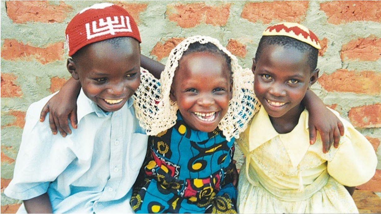
Дети общины Абаюдаия

В основе позиции МВД лежит утверждение о том, что коллектив, состоящий из не евреев по рождению, никогда не может составить «признанную еврейскую общину». Следовательно, любой гиюр, проведенный внутри такой группы, не позволит этим людям получить гражданство Израиля, независимо от течения иудаизма, под эгидой которого был созван раввинский суд.