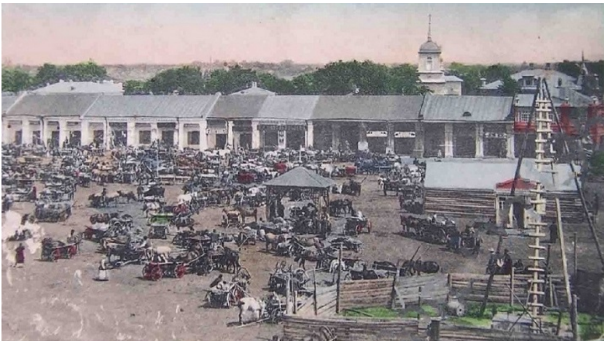
Базарна площа Переяслава на початку XX століття