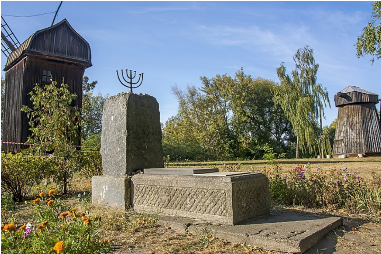
Пам'ятний знак на території колишнього єврейського кладовища

Поховали їх на єврейському цвинтарі, знищеному 1956-го за наказом виконкому. Тоді ж бульдозером знесли всі мацеви, а на місці цвинтаря звели Музей народної архітектури та побуту Середньої Наддніпрянщини. Але досі могильними плитами вистелені укоси пагорба, на якому знаходиться музей. Залишився лише пам'ятний знак цьому цвинтарю, встановлений свого часу Єврейським фондом України.