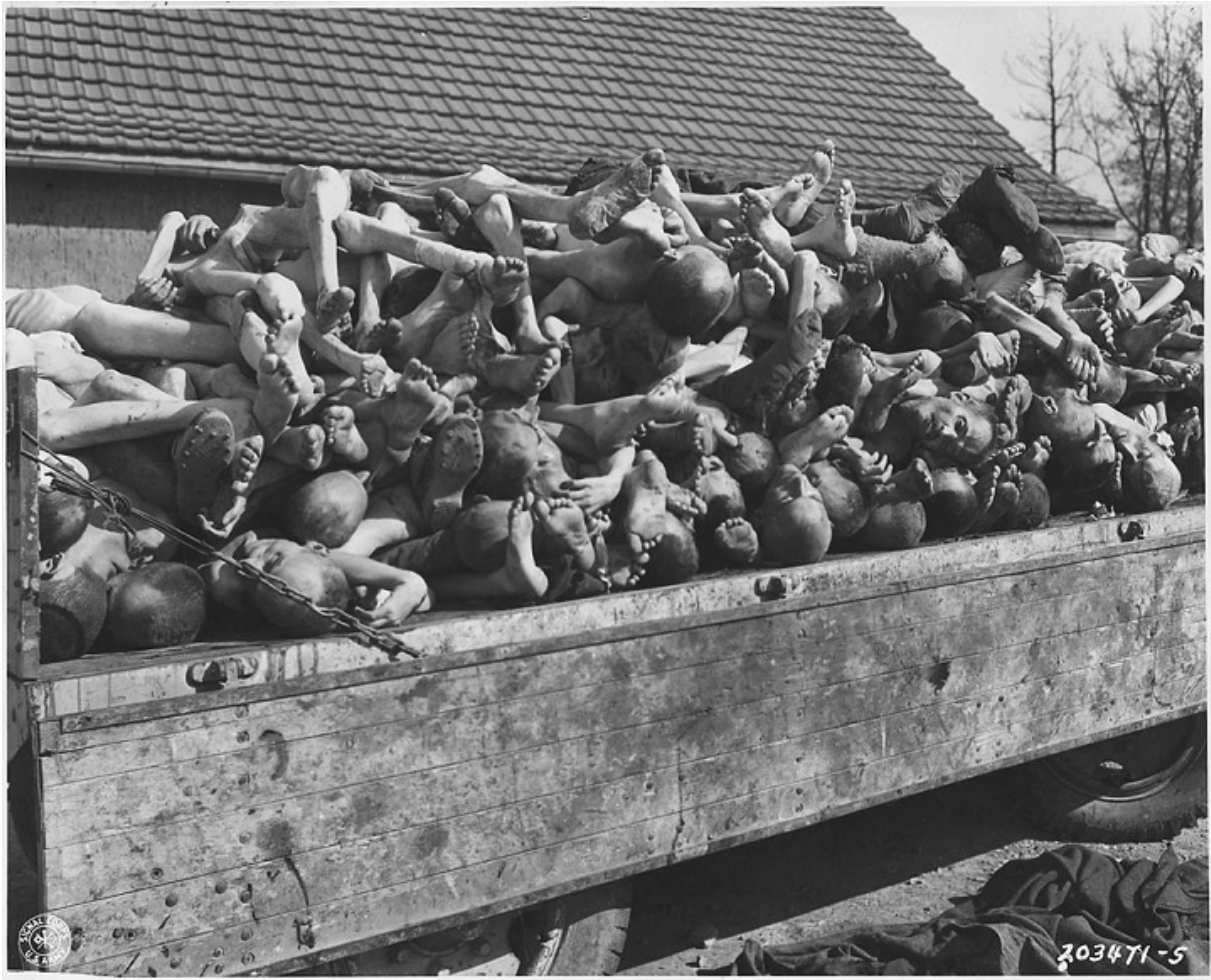
Трупы узников, найденные после освобождения