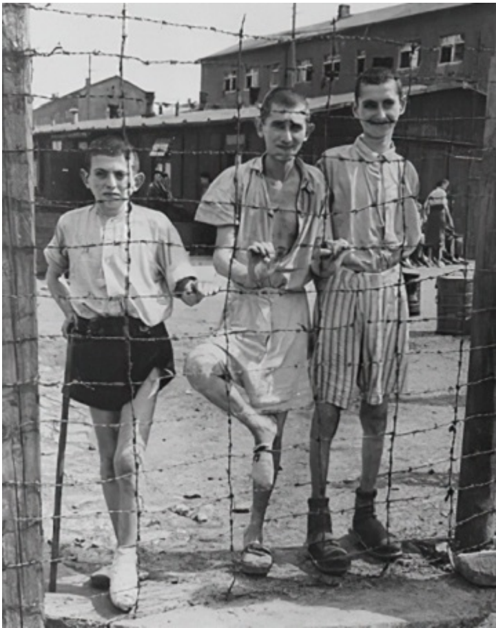
Спасенные еврейские дети из Бухенвальда