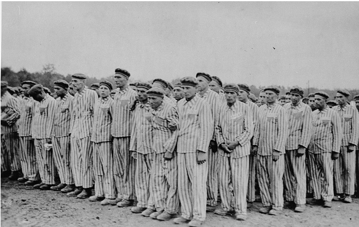
Узники Бухенвальда на перекличке