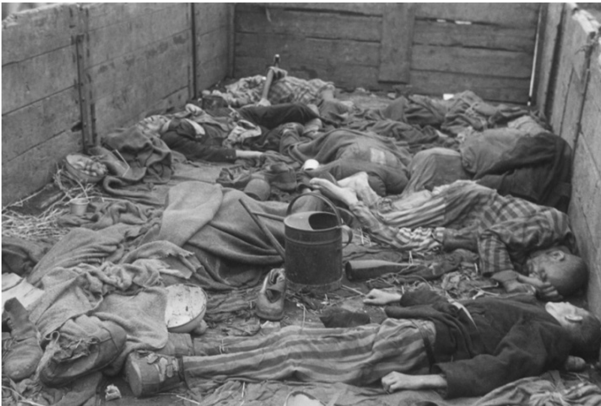
Жертвы марша смерти из Бухенвальда в Дахау