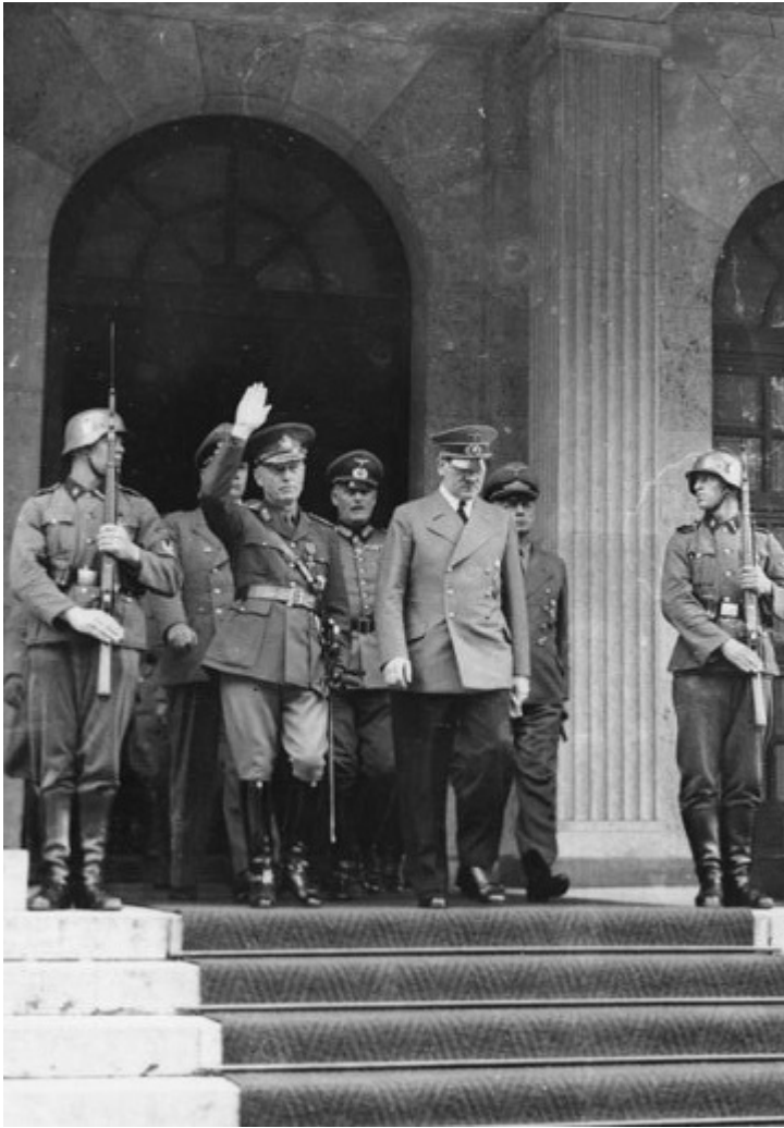
Зустріч Гітлера з Йоном Антонеску