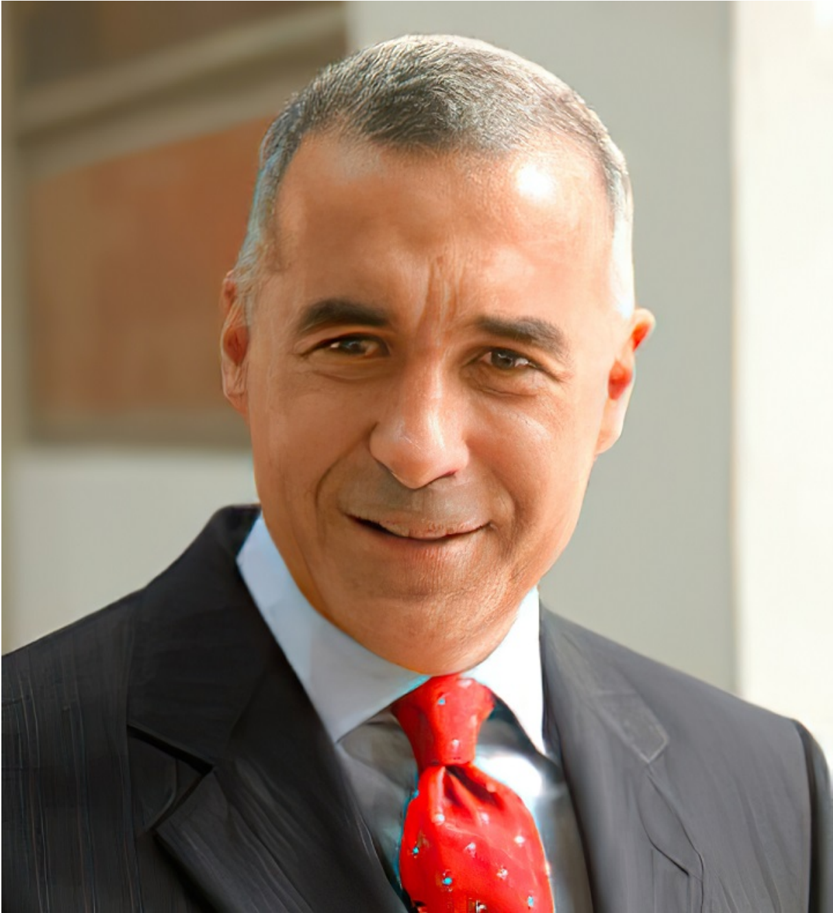
Калін Джорджеску.

Калін Джорджеску з ультраправої партії AUR — відома людина в Румунії. 17 років він пропрацював в ООН як експерт у галузі сталого розвитку, обіймав посаду голови Інституту глобального розвитку ООН, очолював Європейський дослідницький центр Римського клубу.