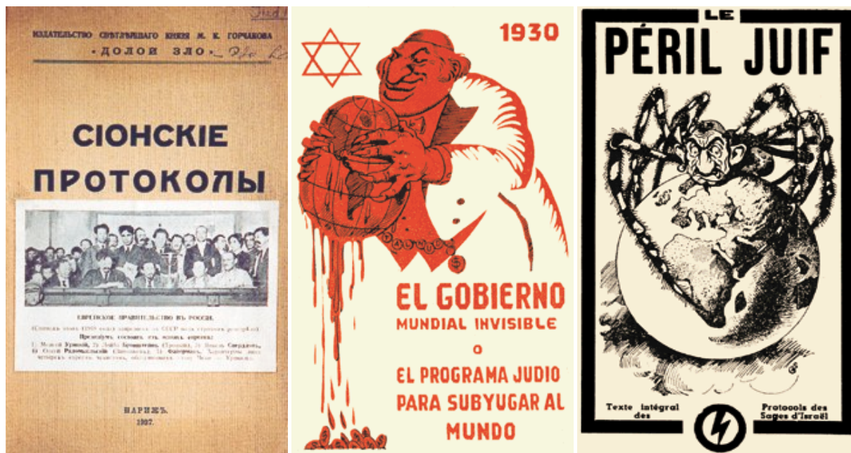
Издания «Протоколов» на разных языках

Есть и иные, более экзотические версии происхождения этого классического антисемитского труда, которые не вписываются в рамки газетной статьи. Интересно другое. «Протоколы сионских мудрецов» родились в XX веке и в нем же должны были тихо скончаться.