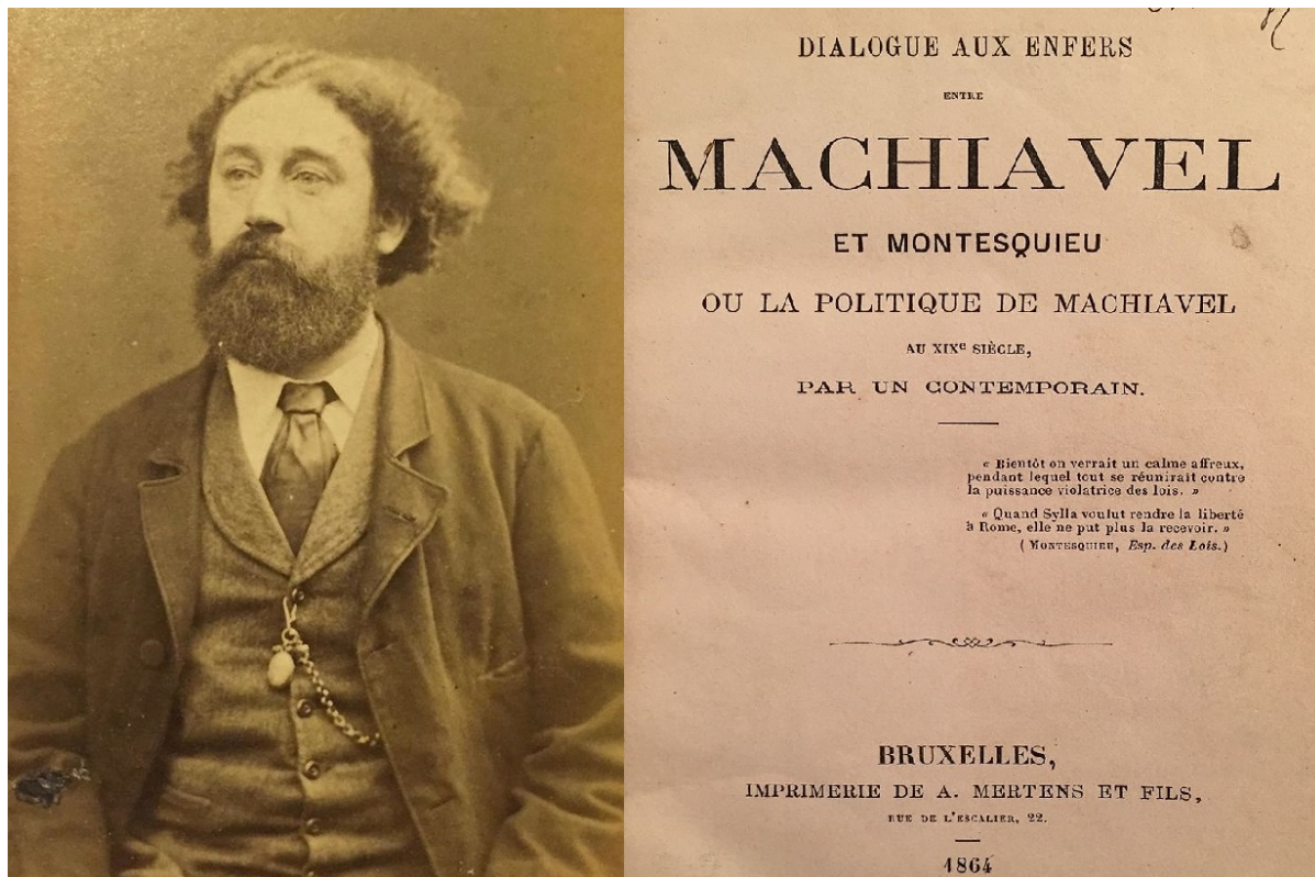
Морис Жоли и его «Диалог в аду между Макиавелли и Монтескье»

Немногие антисемитские памфлеты могут сравниться в популярности с «Протоколами сионских мудрецов». Изданные в начале прошлого века в России, они после октября 1917-го были переведены на многие языки, получив международную известность. Фальшивку распространяли в виде напечатанных на гектографе листовок даже среди делегатов Версальской мирной конференции.