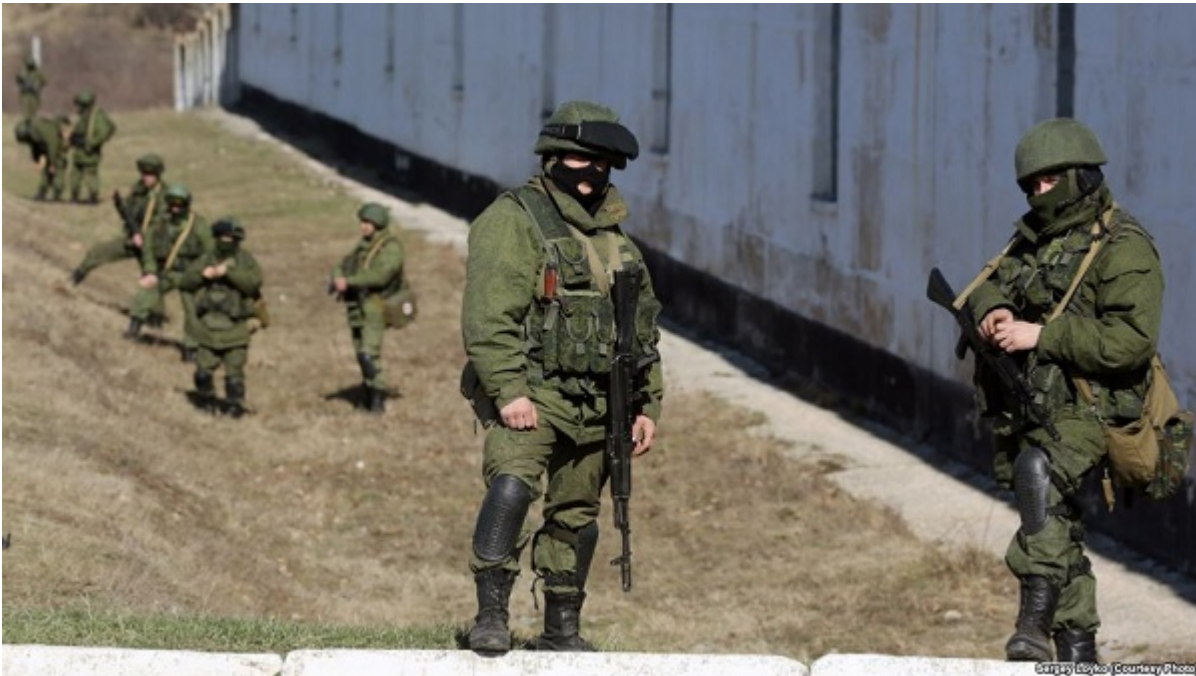
Российские военные на базе в Перевальном, наши дни

* С 1965-го по 1990 год в поселке Перевальное располагался секретный объект — 165-й Учебный центр по подготовке иностранных военнослужащих (УЦ-165). Здесь учили изготавливать и применять взрывчатку, захватывать склады с оружием, проводить диверсии на электростанциях и военных объектах.