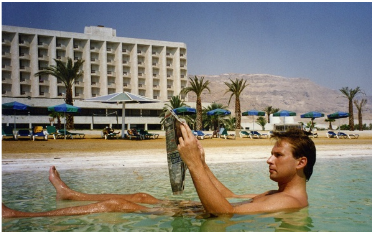
На Мертвом море, 1995

новые перспективы. И практически сразу оказался среди первых украинских дипломатов — у меня был дипломатический паспорт под номером 30.