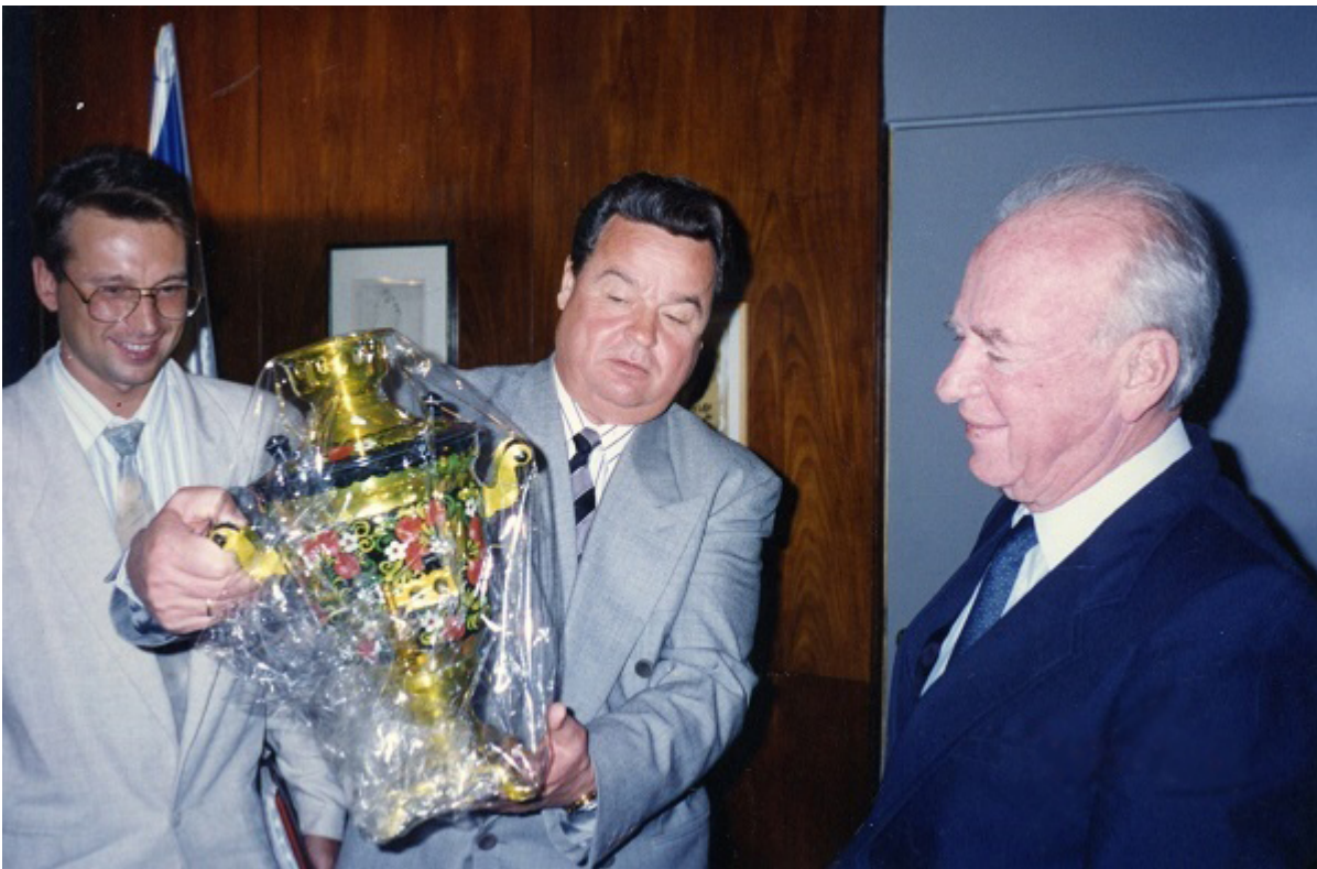
Председатель Верховной Рады Иван Плющ дарит самовар премьер-министру Израиля