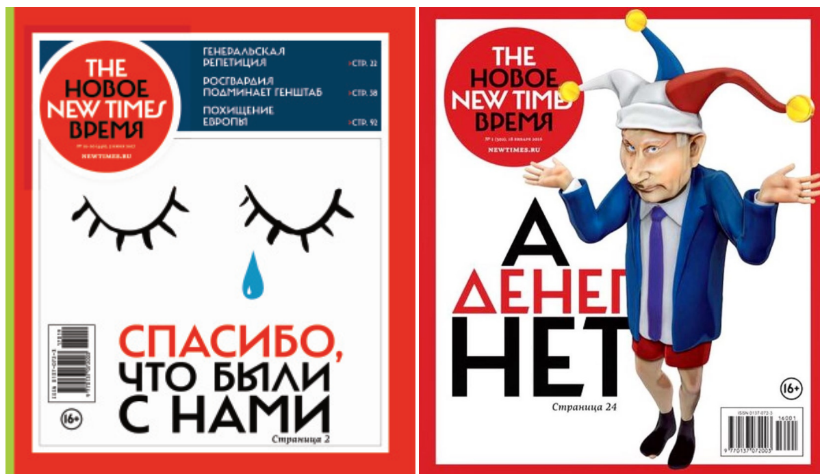
Знаковые обложки New Times