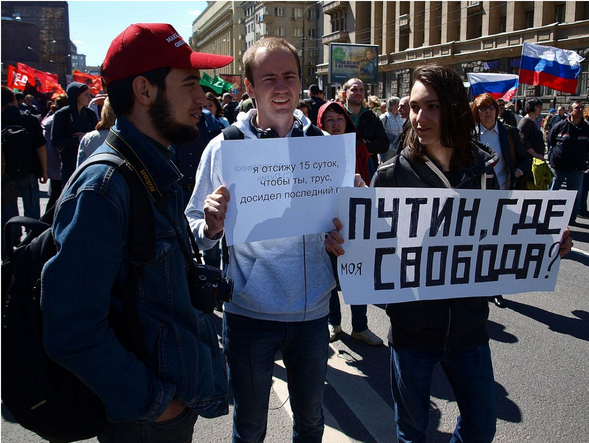
Митинг по случаю пятой годовщины «болотного дела». Москва, 6 мая 2017 года

этнический национализм, — говорит Альбац. — В какой-то момент произошло резкое усиление этно-националистических группировок. Большинство из них получали указания из Кремля. Я всегда говорила, что националистические организации как таковые не опасны, и объединяться на этнической основе вполне естественно. Страшно, когда знамя национализма поднимает государство. Именно это произошло при Путине, когда националистическая риторика стала риторикой правящего режима.