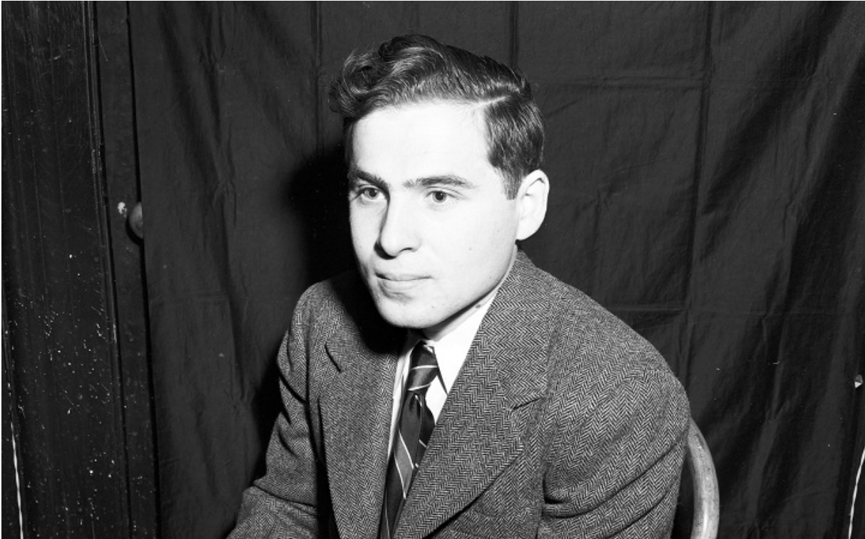
Ученый в молодые годы.

Получив степень бакалавра, Артур продолжил обучение на отделении ядерной физики в Корнеллском университете, где в 1952 году защитил докторат. В том же году он стал научным сотрудником в компании Lucent Technologies, изучая микроволновое излучение и лазерную технику. В 1967 году Эшкин начинает заниматься разработкой лазерных ловушек в Bell Laboratories.