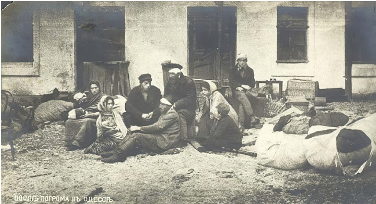
После погрома в Одессе