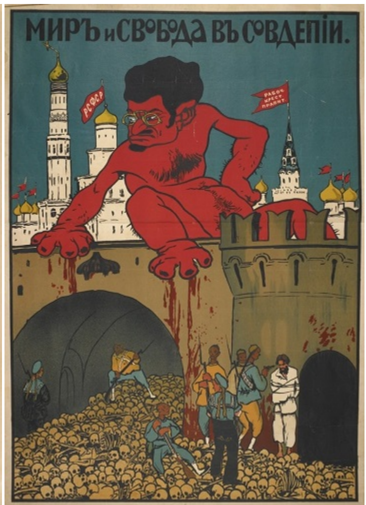
Белогвардейские карикатуры на Троцкого