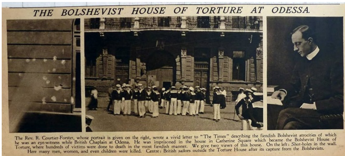
Заметка в английской The Times о зверствах Одесской ЧК, 1919

А спустя время «меч революции» опустился и на Наума, задержанного на границе с письмом, которое он вез от изгнанного Троцкого к Радеку.