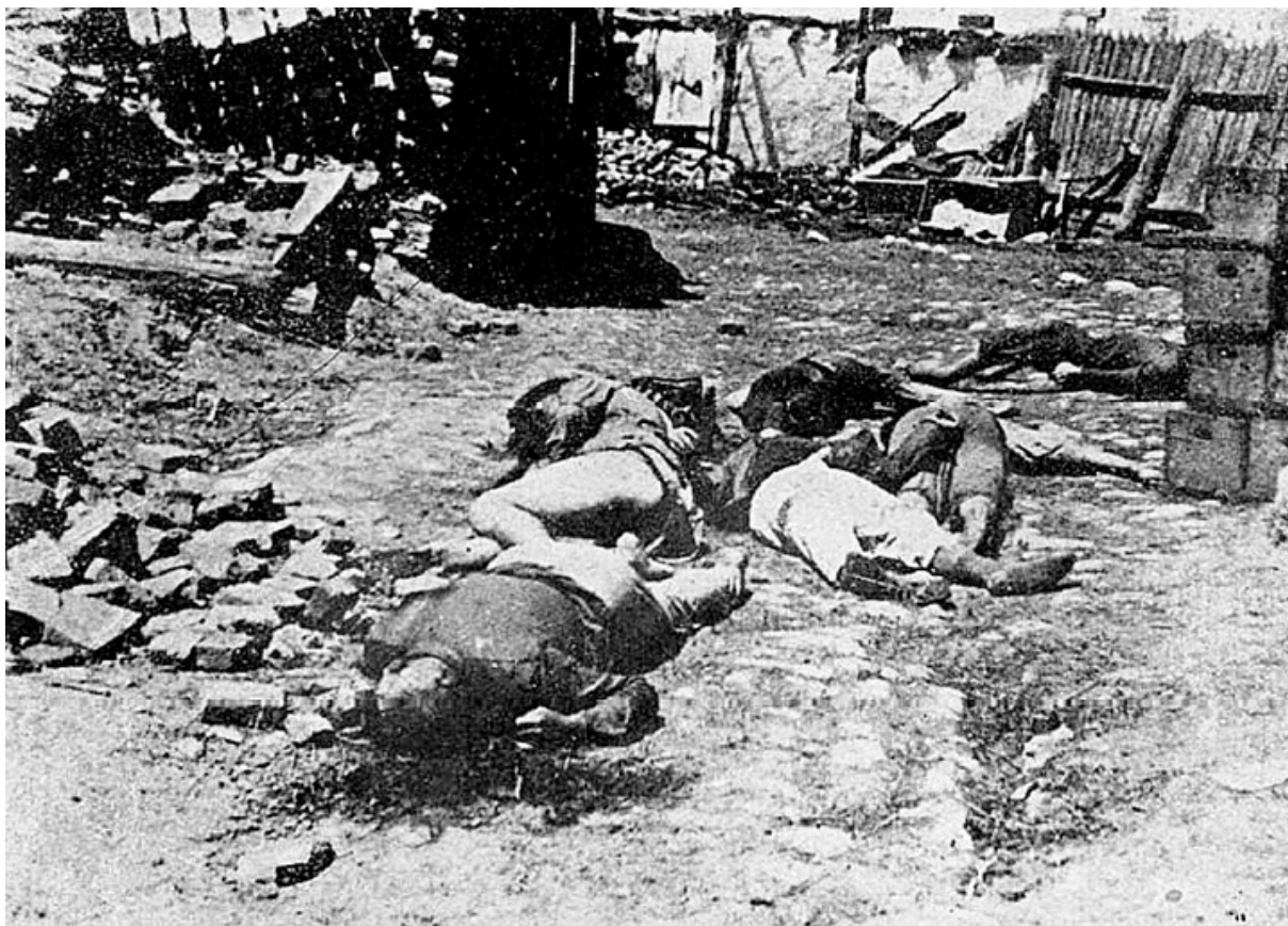
Убитые евреи в селе близ Одессы, 1941

И знакомых в городе нет, у которых можно попытаться переждать, хотя бы ребенка оставить. Мальчик замерз, хнычет. А на дворе чудовищные 25 градусов мороза. Тогда женщина с мальчиком зашли в кинотеатр. Здесь было тепло и можно было сидеть. «Мальчик сейчас же заснул, обхватив обеими руками ее руку выше локтя». Она просидела подряд два сеанса, с трудом понимая, что происходит на экране. Последний сеанс закончился, пришлось опять выйти на улицу. Уже ходили патрули. Комендантский час.