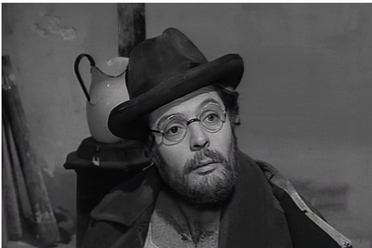
Марчелло Мастроянни, 1963