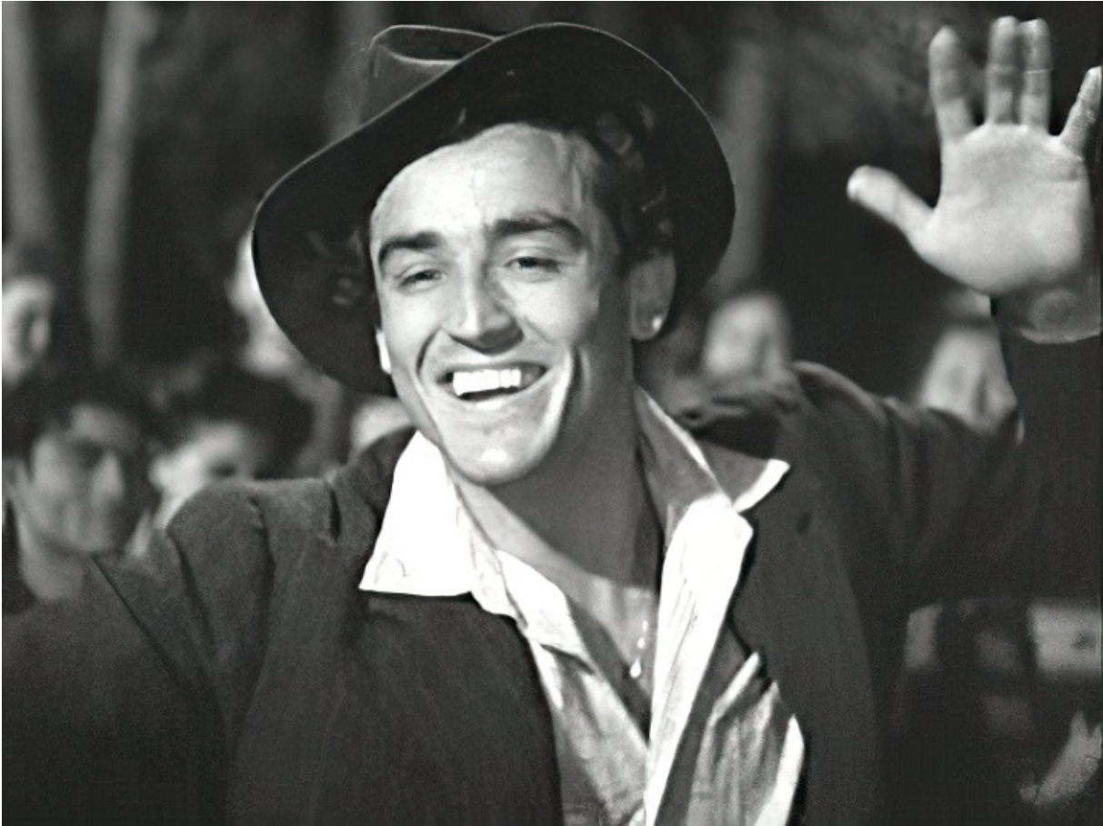
Витторио Гассман, 1949

В американском фильме «Рапсодия», шедшим в советском прокате, его партнершей была Элизабет Тейлор. В другой американской картине — «Война и мир» по роману Толстого — Витторио Гассман сыграл Анатоля Курагина.