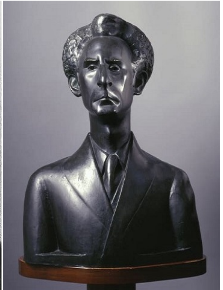
Бюст Гиршбейна авторства Ханна Орловой, 1924