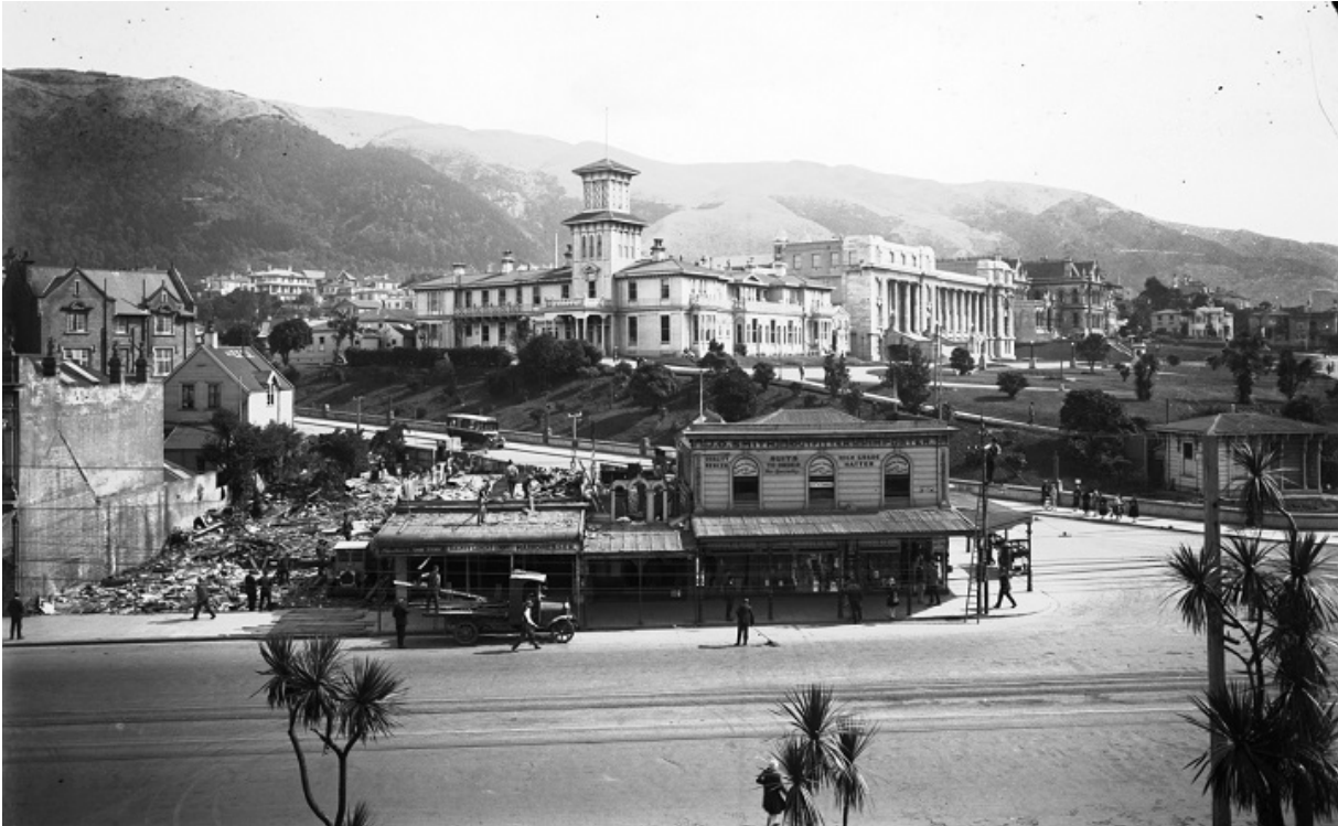
Центр Веллінгтона, 1929

Добрий дельфін, що жив у водах біля Нової Зеландії, був дороговказом для чужих пароплавів, танцюючи поперед пароплавів, як відданий собака, — можливо, його зовсім і не вбили норвезькі рибалки.