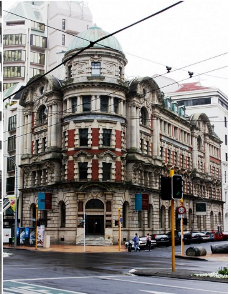
Одно из старых зданий Веллингтона

Але коли я став розпитувати про євреїв у Нової Зеландії, їх кількість, життя, місце в суспільстві — він раптом знітився. Уважно оглянувши мене, суворо запитав: