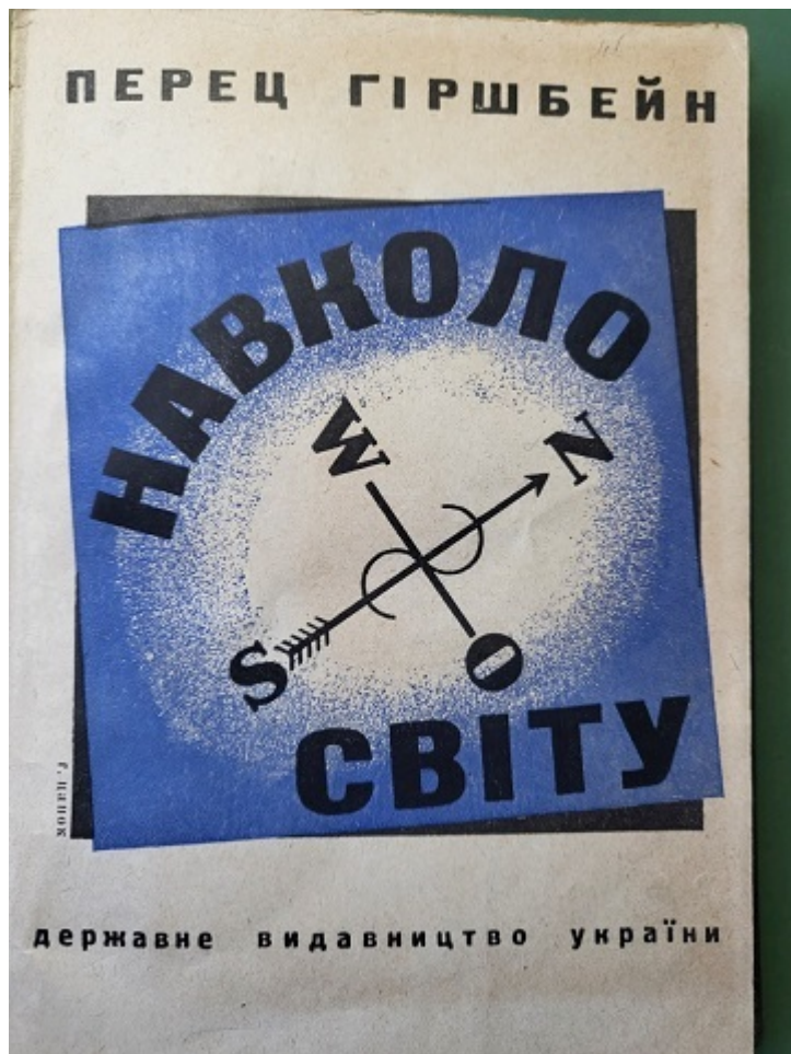
Сборник «Навколо світу», изданный в Харькове в 1929 году