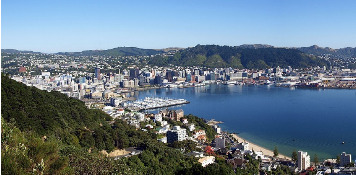
Панорама сучасного Веллінгтона

Я говорив довго. Розповідав про євреїв по всьому світу. Про наше життя — в Америці, в інших країнах, наскільки мені це було відомо. Розповідав про нашу літературу, та про наших письменників.